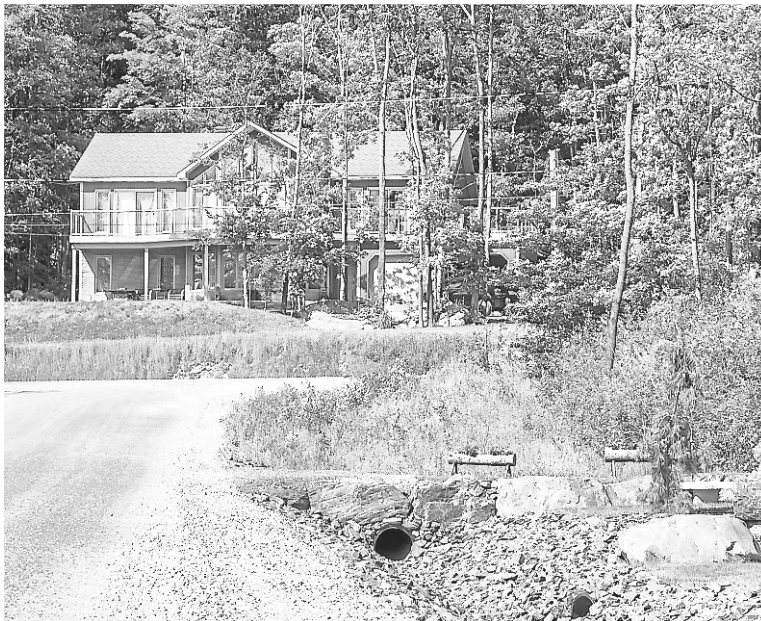
Il y a environ cinq ans, le projet résidentiel de Saint-Gabriel a été mis sur pied pour les jeunes familles.

Présentement, le projet domiciliaire ne connaît pas la croissance attendue : « On a fait trois unités, mais ça ne se vend pas comme on pensait. Ce sont les maisons résidentielles qui vont mieux