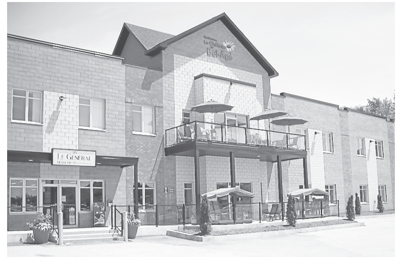
La phase 3 du Château Bel-Âge est utilisable depuis le mois d'avril 2016.

résidents tous les loisirs gratuitement. « On a des activités tous les jours et celles-ci sont toutes gratuites », explique Mme Nadeau. « Le Château du Bel-Âge est un lieu de vie et non d'oubli », ajoute la copropriétaire. C'est pourquoi des gens