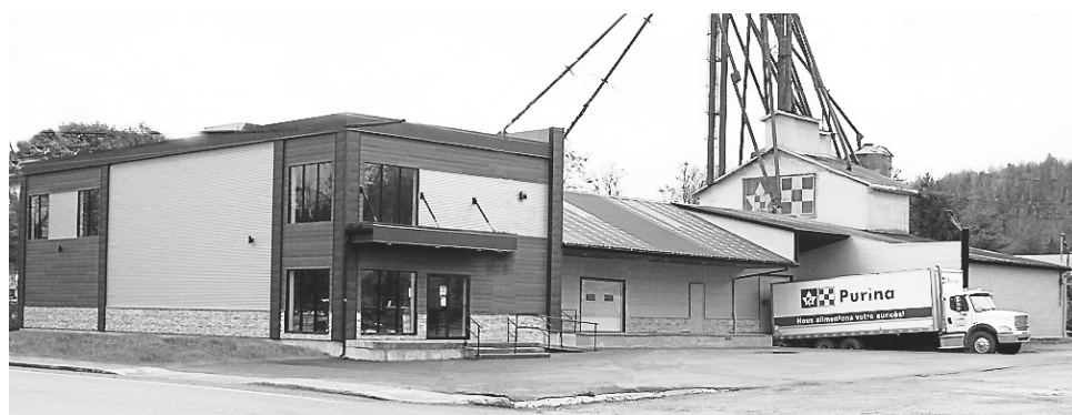
Avec ces récentes rénovations, le magasin Griffes et Sabots répond à une clientèle plus large.

Comme le mentionne Mme St-Laurent, le magasin a un historique. « On a un slogan qu'on aime beaucoup : on est fier de notre passé et on est partenaire de votre avenir. »