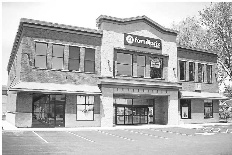
La pharmacie Familiprix de Windsor est désormais située au 83, rue Saint-Georges.

L'ancien presbytère était un choix logique pour aménager la pharmacie, explique Mme Isabelle : « On ne trouvait pas vraiment d'endroit