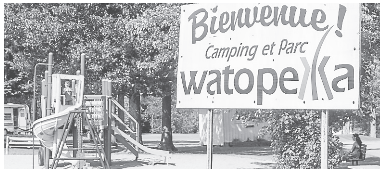
En plus d'un module de jeu au Camping Watopeka, Windsor accueillera une patinoire quatre saisons, des jeux d'eau et aura un terrain de balle amélioré.

Ce nouveau projet fait suite à une demande de la Ville de Windsor au MEES pour accueillir des jeux d'eau près de la piscine municipale, un