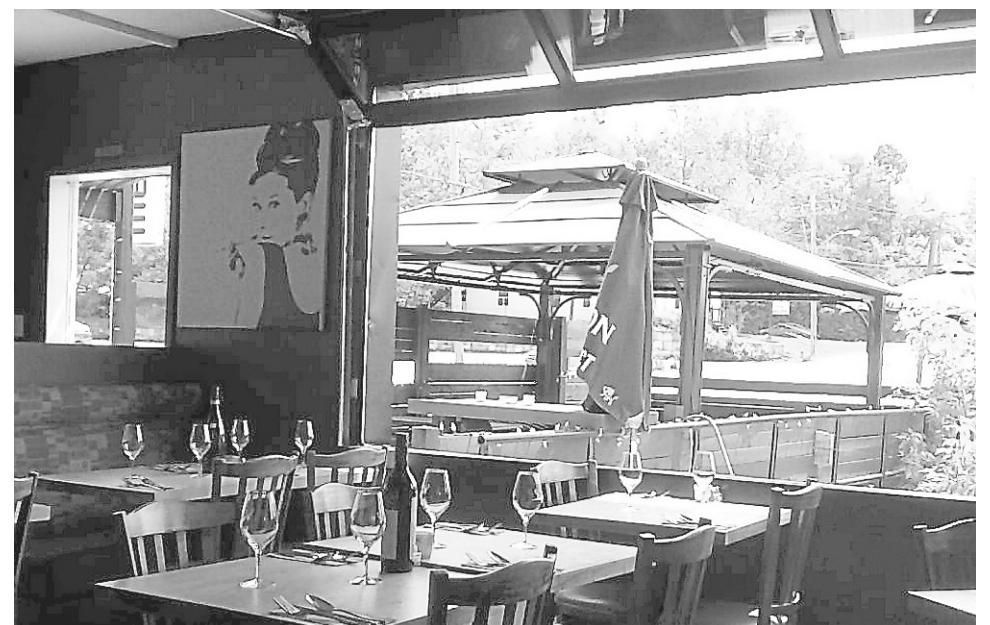
Le restaurant Cariatou est reconnu comme un milieu « intime » qui devient rapidement une soirée dansante.

Les Productions Jean-Bernard Hébert présentent