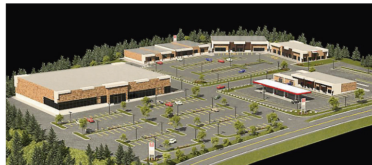
Maquette du quartier du Moulin, qui verra probablement le jour à l'entrée du Parc de la 55 d'ici l'été 2017. — MAQUETTE FOURNIE

« Pour ce secteur, on est en dépôt d'offres pour une entreprise qui pourrait peut-être s'installer dès l'automne. Alors ça dépend, il y a beaucoup d'impondérables là-dedans. En développement économique, il y a une partie de chance et de bon timing. »