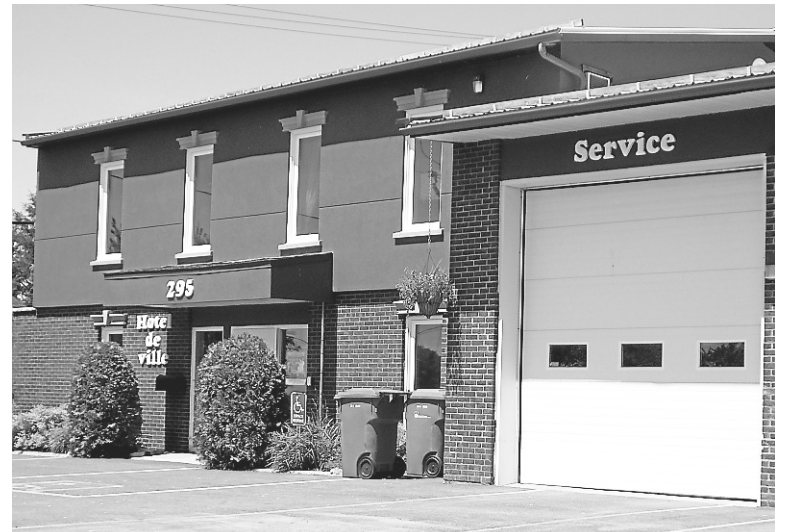
La population de Saint-Claude pourra dès 2017 faire la collecte des matières organiques putricides.

Saint-Claude participera désormais au programme concernant le développement durable, M. Provencher croit que « cela va aller très vite avec les bacs bruns et que le tout sera traité intégralement ». Il croit également que si l'ensemble des municipalités avait été de l'avant avec ce projet de compost, « cela aurait dû être accepté depuis les années 2010. »