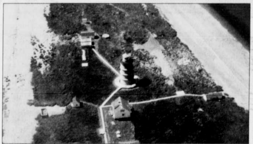
Les installations du phare sont bâties au centre de l'île et reliées par des trottoirs de bois, qui protègent une végétation... plutôt pauvre.