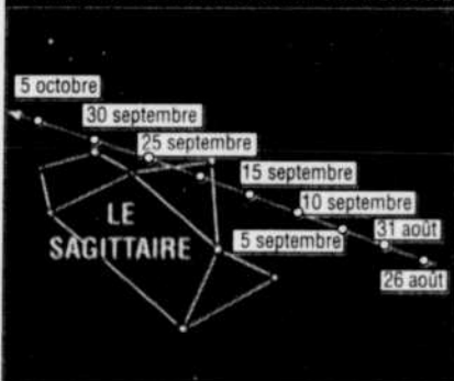
INFOGRAPHIE PLANÉTARIUM DE MONTRÉAL / LE SOLEIL

La trajectoire de Mars dans la constellation du Sagittaire au cours du mois de septembre.