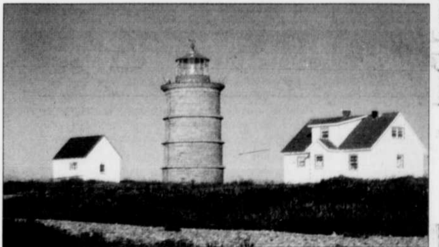
Malgré les embruns salés, les intempéries et les hivers rigoureux, la tour de l'île Rouge se tient toujours bien droite après 153 ans d'activité.