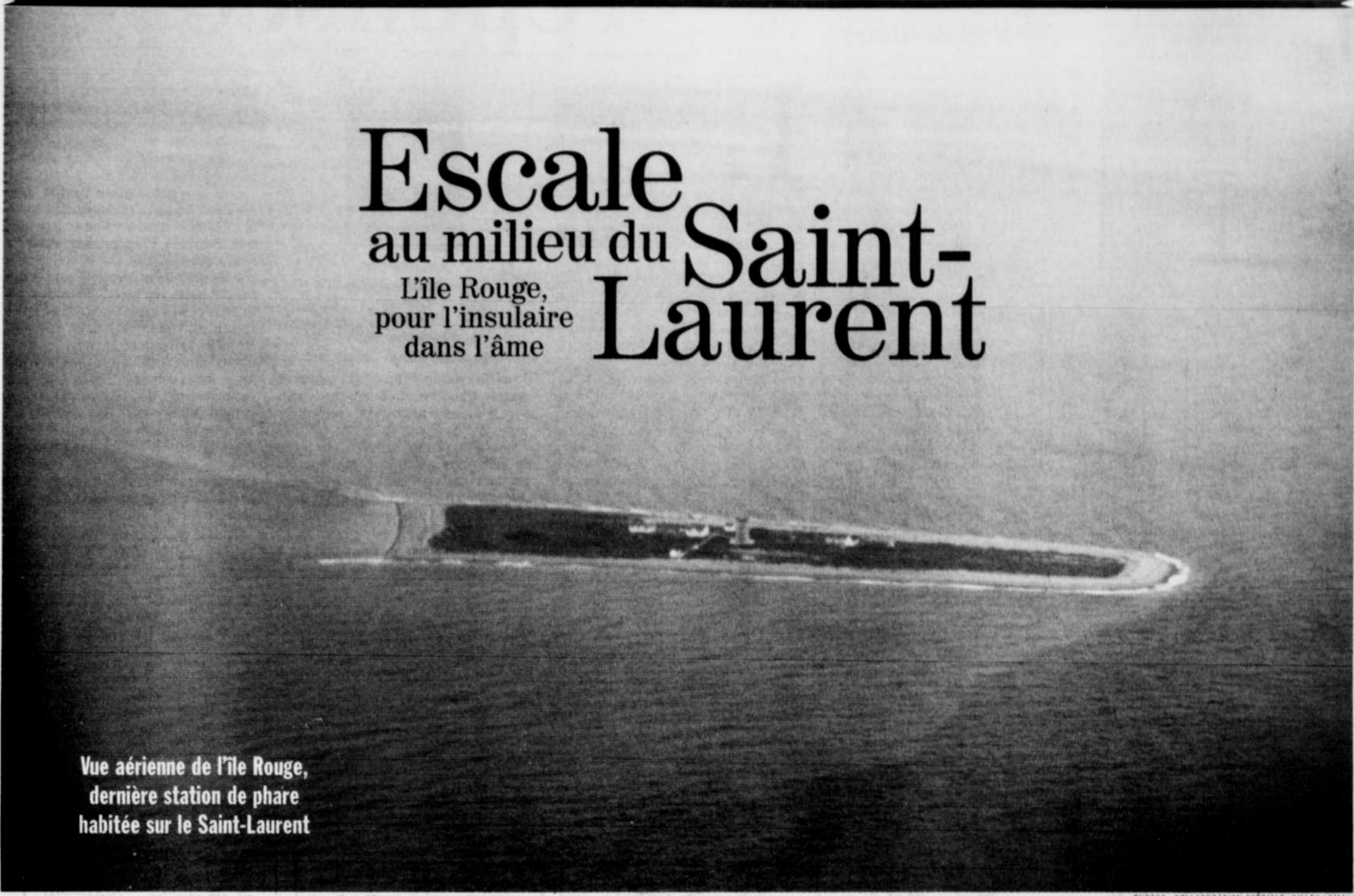
Vue aérienne de l'île Rouge, dernière station de phare habitée sur le Saint-Laurent