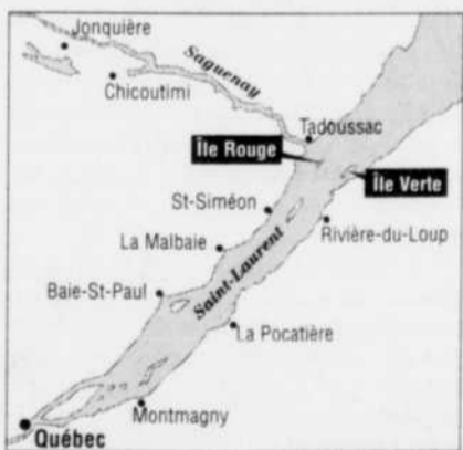
INFOGRAPHIE: LE SOLEIL

L'île Rouge est située entre les chenaux nord et sud, juste en face de l'embouchure du fjord du Saguenay et à une dizaine de kilomètres de l'île Verte, sa voisine au sud. Elle se trouve à la croisée des estuaires moyen et maritime, dans la partie la plus dangereuse du fleuve. Car c'est là que les eaux douces du Saguenay se mélangent aux eaux salées du fleuve, créant des courants contraires, qui rendent la navigation périlleuse. Aussi parce que durant l'été, le brouillard y est fréquent, causé par la rencontre de l'air chaud et de l'eau froide. Et finalement parce que cet flot ourlé d'une dentelle blanche que vous avez aperçu à vol d'oiseau, possède, à marée basse, une batture qui est au moins 14 fois plus grande que l'île elle-même. Envoutante pour les marins, mais dangereuse!