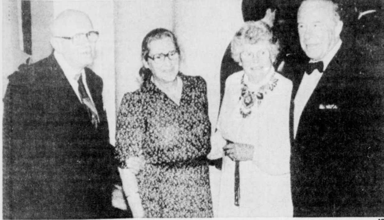
Fidèle à ses prises de position sur les dissidents, le président Reagan avait invité Andreï Sakharov et son épouse Yelena Bonner, tous deux à gauche sur notre photo, au dîner qu'il offrait hier soir en l'honneur de M. et Mme Mikhaïl Gorbatchev. Le célèbre couple soviétique a été accueilli par M. et Mme George Shultz, à droite.

Avant de regagner Moscou, Mme Reagan est allée s'incliner et déposer des fleurs devant le monument aux défenseurs de Leningrad, cette ville qui fut assiégée de 1941 à 1944, faisant 650,000 victimes. Mme Reagan s'est déclarée « très impressionnée ».