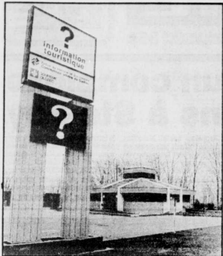
L'aubergiste Raymond Malenfant intégrera le kiosque d'information touristique de la CUQ dans l'ensemble hôtelier de $14 millions qu'il s'approprie à construire à Sainte-Foy.