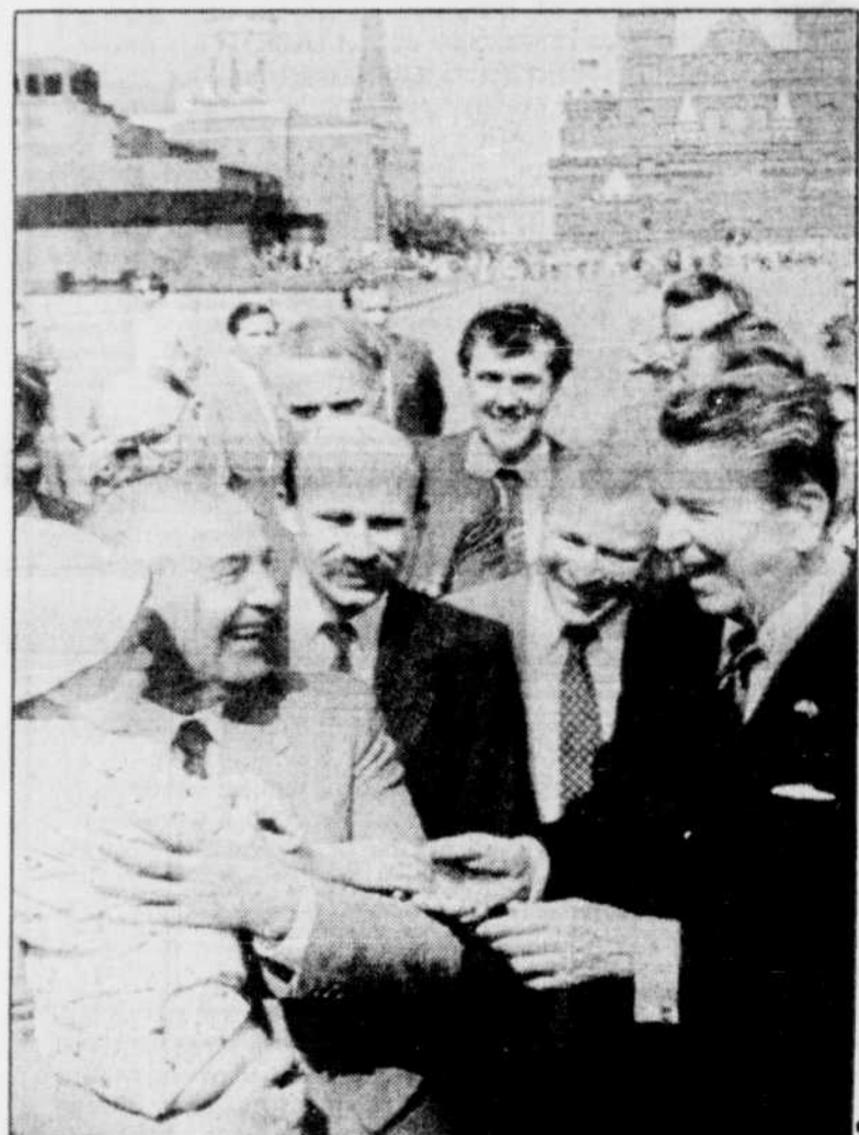
Mikhail Gorbatchev et Ronald Reagan ont effectué une sortie impromptue, hier, sur la Place rouge, où ils ont pu échanger avec jeunes et vieux avant de retourner discuter de l'épineux problème du désarmement.