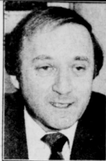
Le ministre des Affaires municipales, M. André Bourbeau.