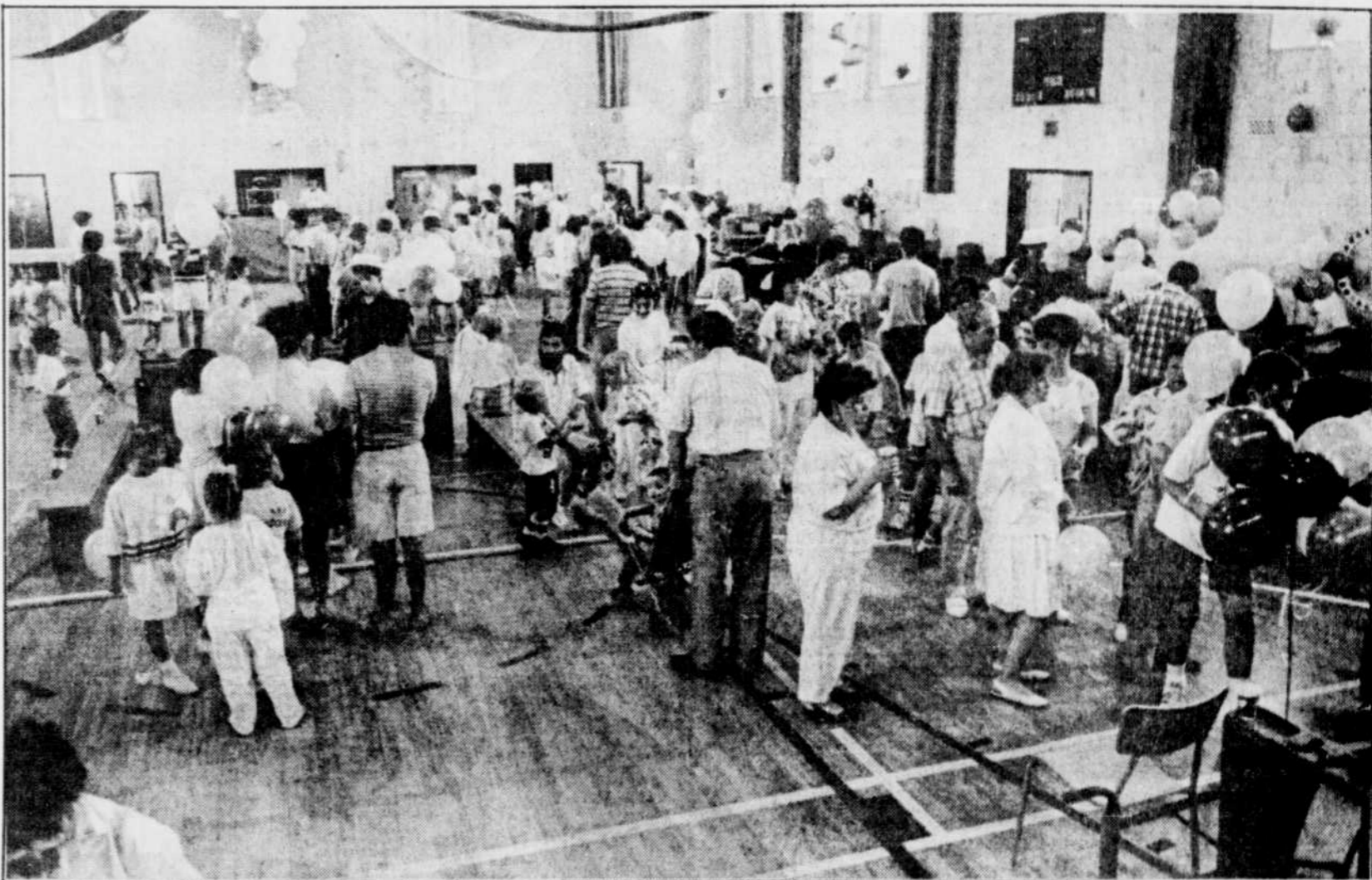
Le grand gymnase du Patro de Charlesbourg où avait lieu une kermesse, en fin de semaine dernière.