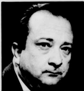
Pierre DESGRAUPES commente des livres à «Lectures pour tous», à 12 h 30.