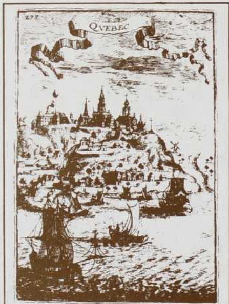
Bibliothèque Nationale du Québec