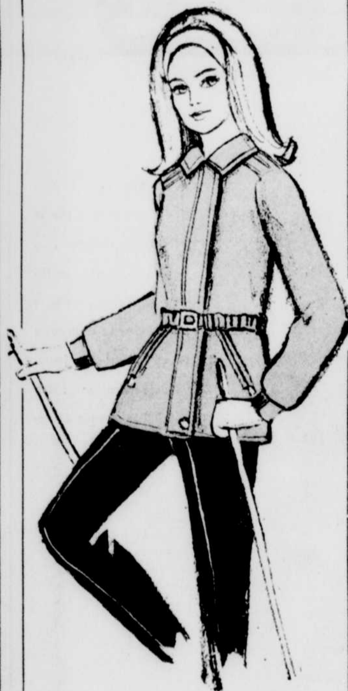
Cagoules en nylon, modèle instructeur ou régulier