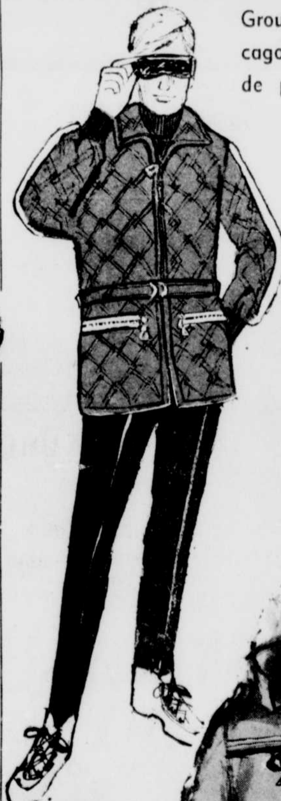
Groupe de cagoules et de pantalons

Sport pour dames (rayon 3542) deuxième étage. S.V.P. pas de commandes postales ou téléphoniques.