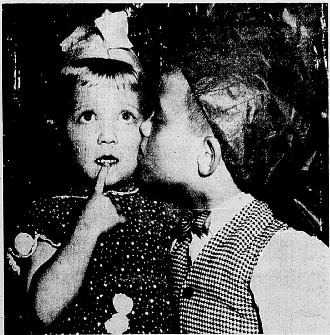
La Fête des Rois, tout en étant fort joyeuse et animée, ne marque pas moins pour les petits et les grands, la fin de la période des Fêtes. En France, la couronne de reine et un gentil becquet de son frère, ne suffisent pour lui enlever le regret qu'elle éprouve de tous ces beaux jours écoulés. Mais l'en fais pas fillette, tu verras bientôt que les Noël se succèdent beaucoup trop vite...

M. le Dr Jules Morin prie sa clientèle de prendre note qu'il sera absent de ses bureaux au cours des semaines à venir. Les bureaux seront cependant ouverts pour ceux qui désirent se procurer des médicaments et pour la comptabilité.