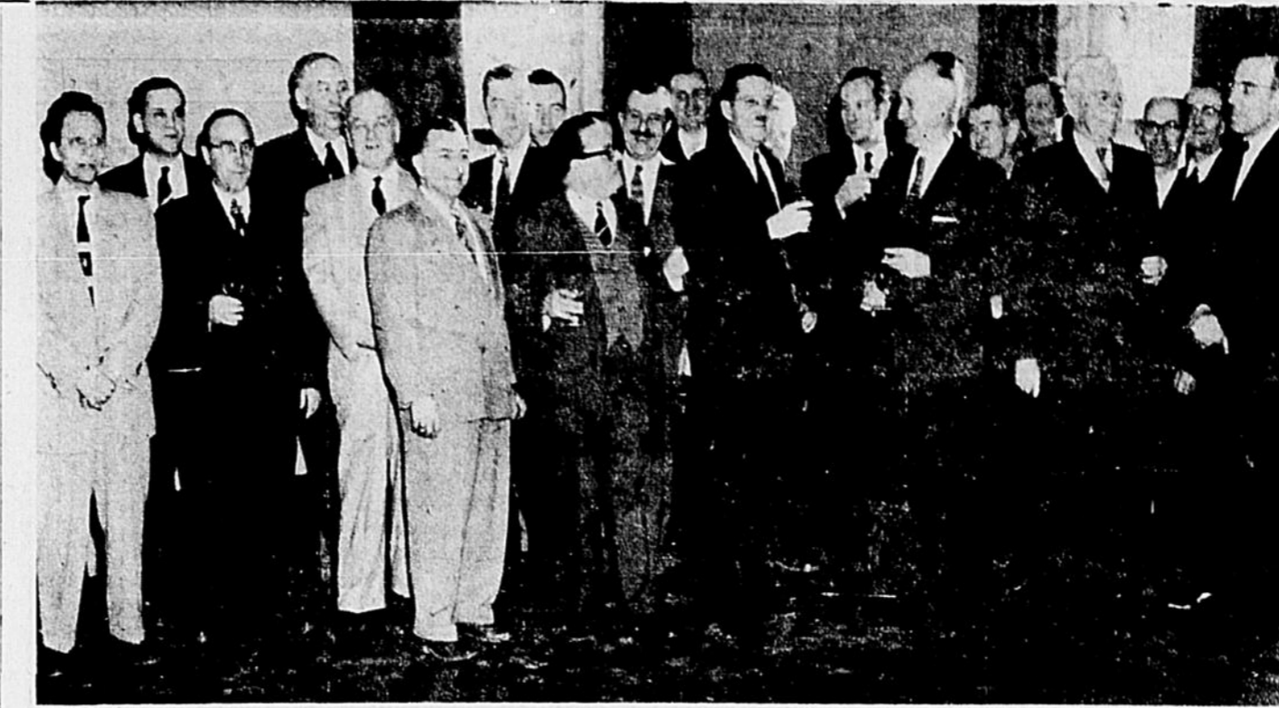
Cette photo a été prise, samedi après-midi, à l'occasion d'une réception offerte par les membres du conseil municipal de la Cité de Saint-Hyacinthe, à tous les contribuables de la ville. Inaugurée pour la première fois à Saint-Hyacinthe, cette initiative avait pour but de favoriser une rencontre amicale des électeurs et des autorités municipales, en ce début d'année. Voici une partie du groupe qui assistait à la cérémonie.

Q. — Dans UN CAPRICE de Musset, M. de Chavigny voudrait bien savoir quelle est la femme mystérieuse qui lui a fait parvenir une bourse par un domestique. Est-elle brune ou blonde, demandé-t-il à Mme de Léry. Comment celle-ci évince-t-elle la question? R. — Elle répond qu'elle est bleue.