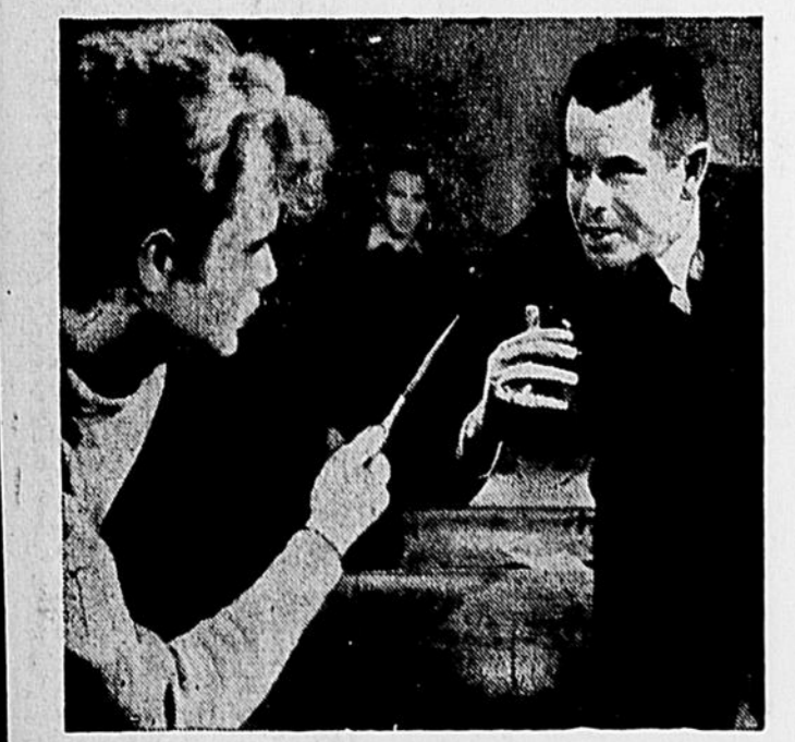
Glenn Ford essaie d'enlever le couteau que son élève lui pointe dans cette production du film "Blackboard Jungle". Ce drame, le plus puissant de l'année, est à l'affiche au Ciné Maska, à compter d'aujourd'hui, pour quatre jours.