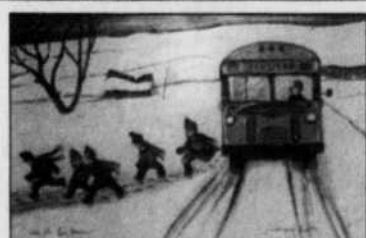
Normand Hudon PEINTURES ORIGINALES