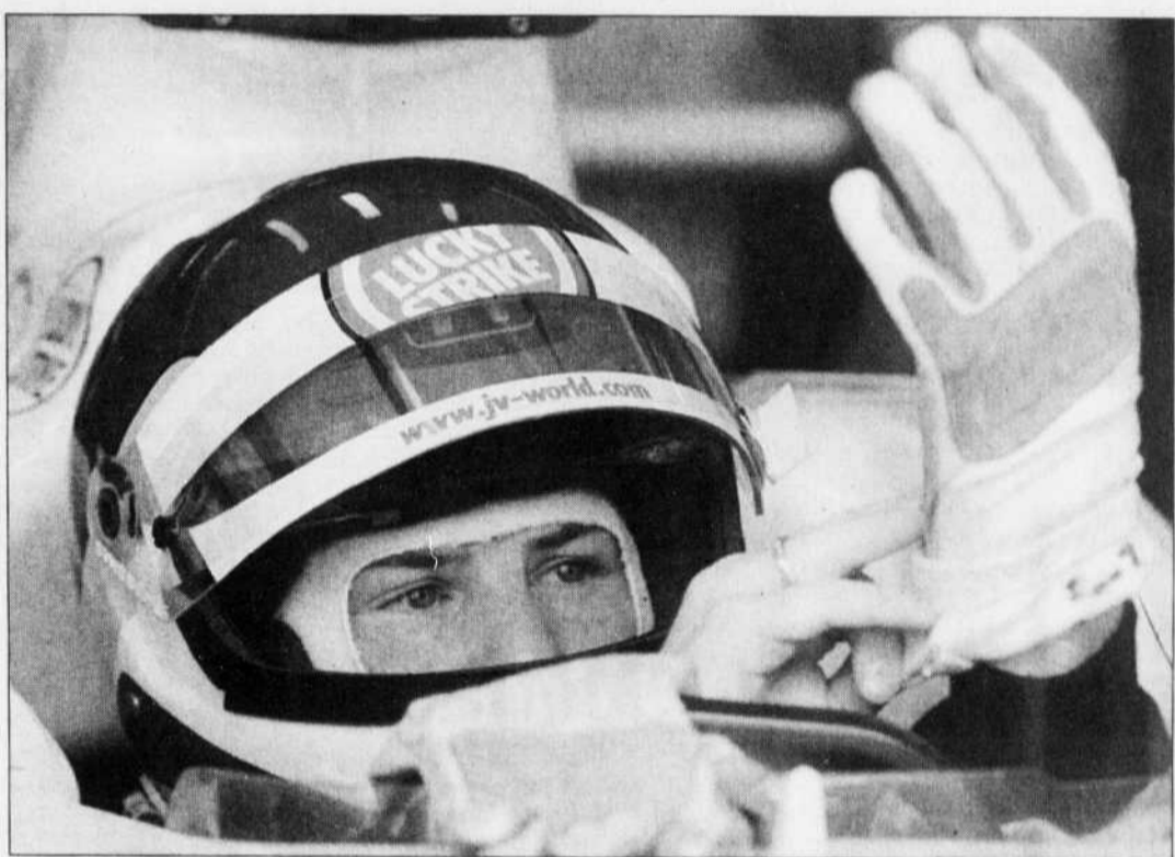
Jacques Villeneuve ajuste son gant, avant de s'élancer sur la piste du Grand Prix de Malaysia.

Derrière le quatuor de tête, le Finlandais Mika Salo a placé la Toyota à 1,67 seconde, devant la deuxième Williams-BMW de Juan Pablo Montoya et l'autre Ferrari du Brésilien Rubens Barrichello.