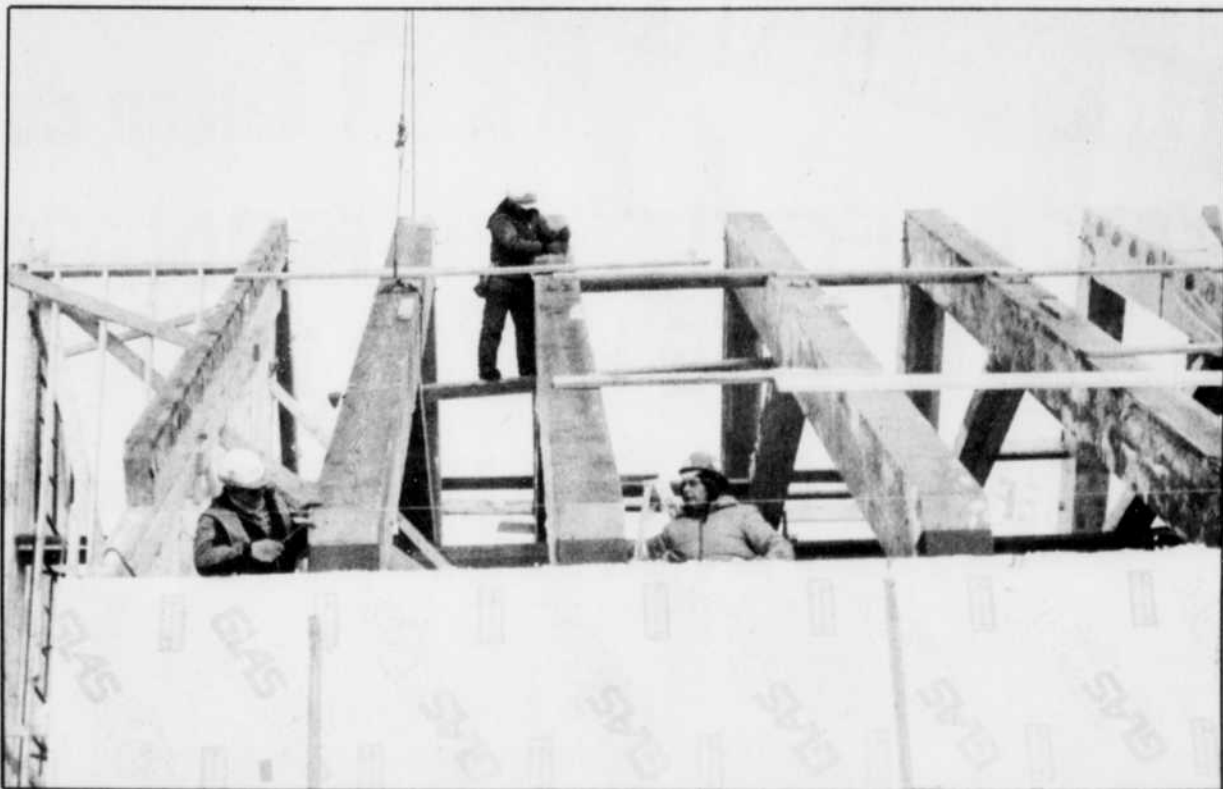
Les ouvriers installent les fameuses fermes de toit, qui supporteront le toit cathédrale de la Grande Maison.