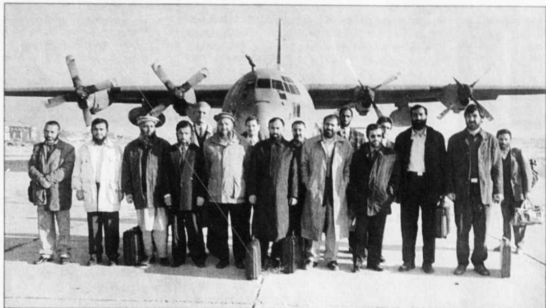
Délégués afghans et conseillers allemands à l'aéroport de Bagram, près de Kaboul, hier.

Ces 25 hommes et trois femmes auront pour tâche,