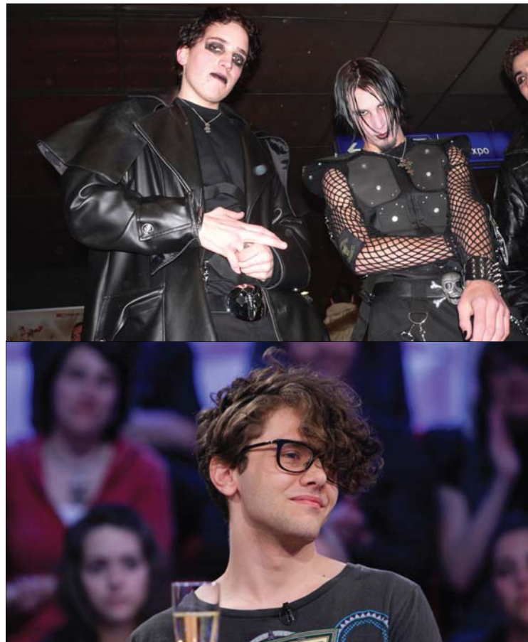
De haut en bas : Un haineux costume de goth/emo. Un hipster type.

Un de mes costumes préférés : ça respire la classe, beaucoup de classe. Il est simple à réaliser aussi : il suffit d'un complet noir, d'une chemise blanche et d'un nœud papillon noir. [Parenthèse professionnelle obligatoire : si vous n'avez pas de complet, il serait temps que vous fassiez un tour dans une boutique : il s'agit d'un outil de réseautage essentiel pour votre carrière.] En fait d'accessoire, un pistolet en plastique suffit. Faites toutefois attention à ce que votre arme soit visiblement fausse (ex : bout en plastique rouge), car un objet réaliste peut faire réagir bien des gens, en particulier les portiers et les policiers. Geste obligatoire dans un bar : commander un martini « shaken, not stirred » (secoué, non remué). Comme dirait M. Bond : « Perfect ».