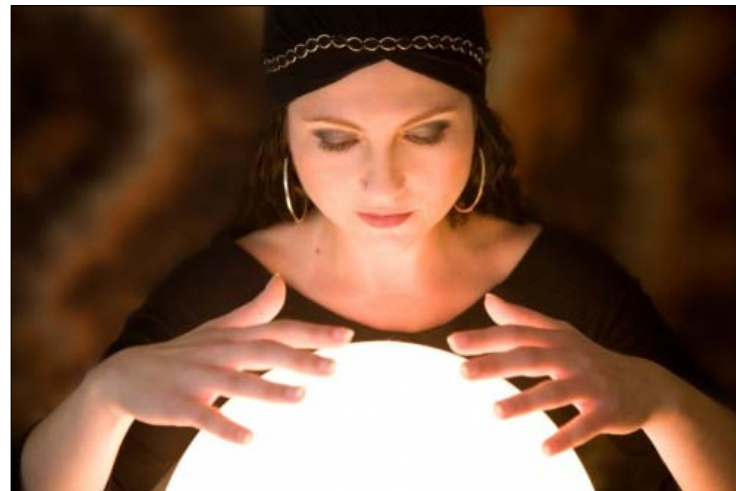
En haut: Maurits C. Escher qui avait une fixation pour les boules de cristal