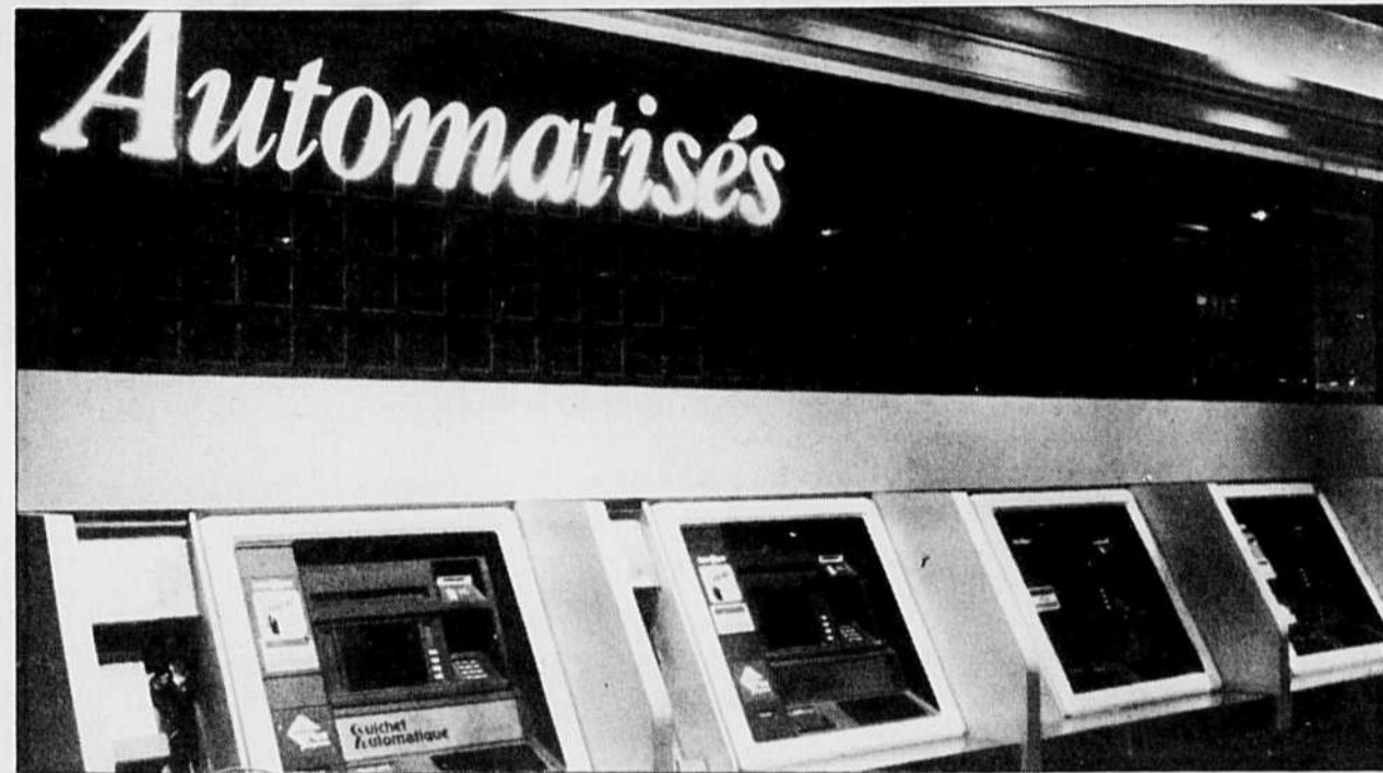
Les délits auraient tous été commis à l'intérieur même des établissements, au moment où s'effectuait l'approvisionnement des guichets automatiques.

■ Des employés et des agents de sécurité de Secur font partie des suspects