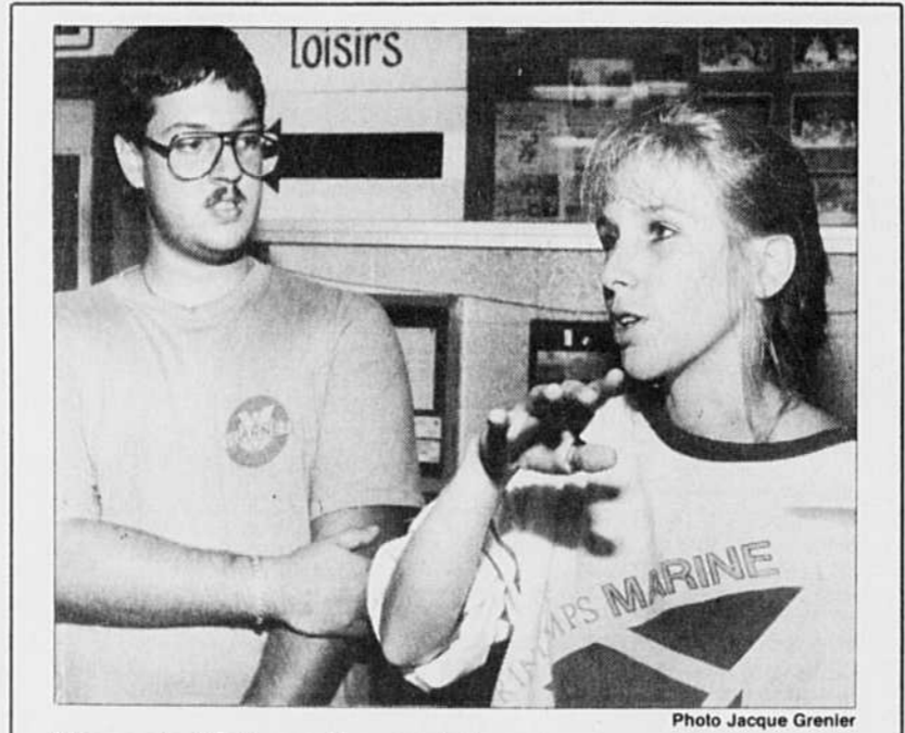
Ils ont dû tuer leur chien

Les quantités entreposées à Montréal sont nettement inférieures à celles retrouvées à Saint-Basile, selon M. Brunelle, qui ajoute que le plus important site potentiel montréalais comportait environ 25 barils d'huiles contaminées.