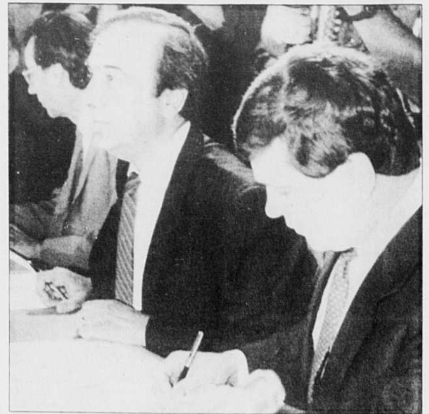
Robert Bourassa, premier du Québec, Jos Ghiz, premier ministre de l'Île-du-Prince-Édouard, et Frank McKenna, du Nouveau-Brunswick, paraphent l'entente, à Charlottetown.

ans. Quant au ministre québécois de l'Énergie, M. John Ciaccia, il a souligné que le contrat prouvait la capacité des provinces à s'entendre en matière énergétique sans l'intervention du gouvernement fédéral. « On montre à Ottawa qu'on a pas besoin de réglementation nationale en matière de ventes d'énergie, a-t-il dit. On peut s'entendre entre nous sans réglementation fédérale ». Le contrat de vente couvre une période de six ans qui s'étend de novembre 1988 à octobre 1994. La quantité vendue par le Québec, 50 mégawatts, représente environ le quart de la consommation électrique des 130.000 habitants de l'île. La vente ne suppose la construction et l'aménagement d'aucun équipement additionnel, toutes les installations requises étant déjà sur place.