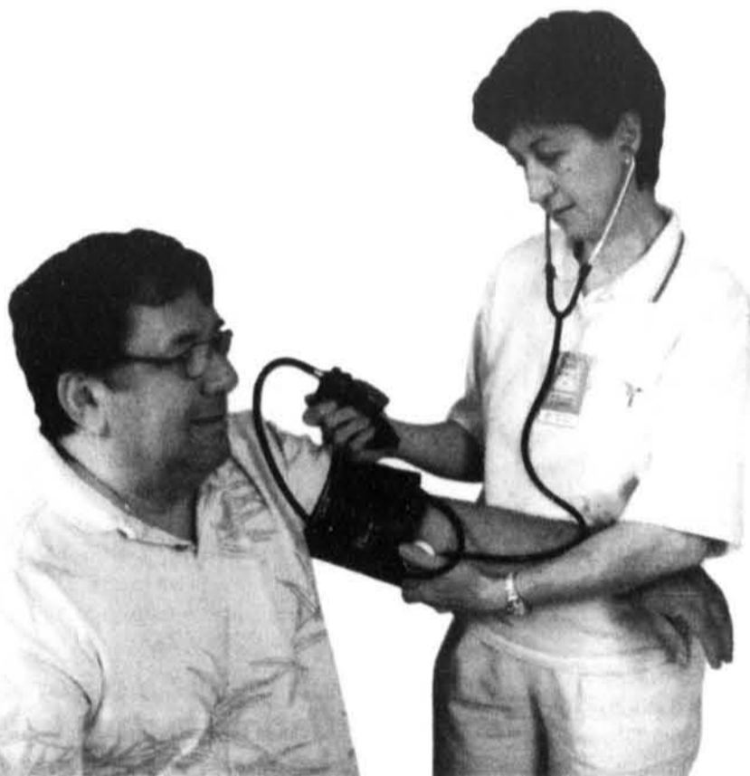
Une visite annuelle chez le médecin permet de prévenir plusieurs troubles courants chez les hommes.

Le bilan de santé des hommes n'est pas des plus reluisants. Le principal responsable : le manque de prévention. En fait, un simple changement d'attitude pourrait grandement améliorer leur qualité de vie.