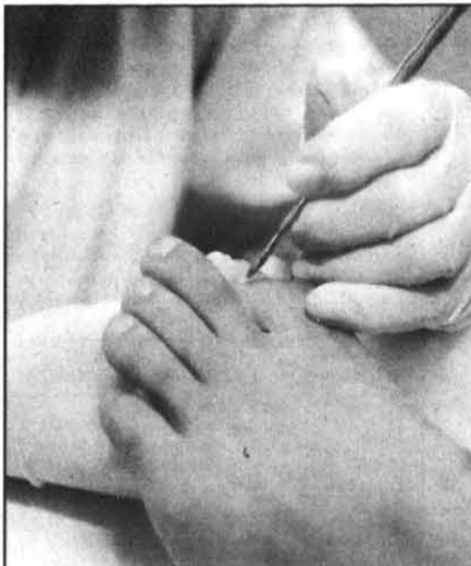
Les pieds sont fragiles et méritent de recevoir des soins, méritent qu'on leur fasse attention.

Premiers cours gratuits Du 20 au 24 septembre