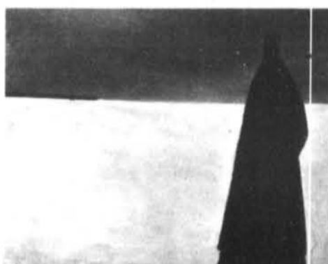
Jean-Paul Lemieux, le visiteur du soir (détail), 1956, Collection du Musée des beaux-arts du Canada.

Pour célébrer de façon significative le centenaire de la naissance de Jean Paul Lemieux (1904-1990), le Musée des beaux-arts du Canada a choisi de lui rendre hommage dans une très attendue exposition qui présentera une trentaine d'œuvres qui soulignent la peinture de paysages. Un catalogue illustré viendra enrichir l'exposition. Après Ottawa du 22 octobre au 2 janvier 2005 cette exposition poursuivra sa route vers le Musée national des