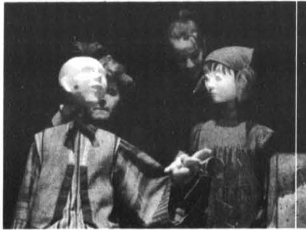
Les splendides marionnettes du Théâtre de Sable, que l'on a pu voir dans Maïta, sont aussi en vedette dans «La Chevelure de Bérénice».