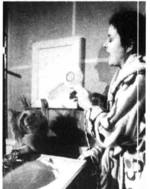
Comme les tout-petits pourront le constater dans la pièce «Le Bain», le moment du bain peut s'avérer propice à la tendresse et à l'imaginaire.

Dans sa série pour l'enfance, le Centre National des Arts accueille, pour les 8 à 12 ans, la pièce «Miroir, miroir...» les 9 et 10 octobre. Créée par une toute nouvelle compagnie, Les