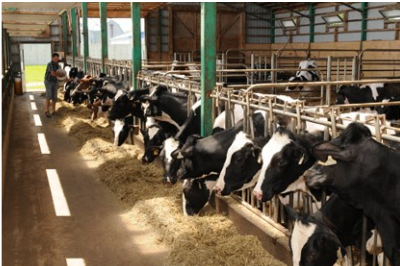
Le troupeau compte 160 têtes de race Holstein. The heard contains 160 head of Holsteins.