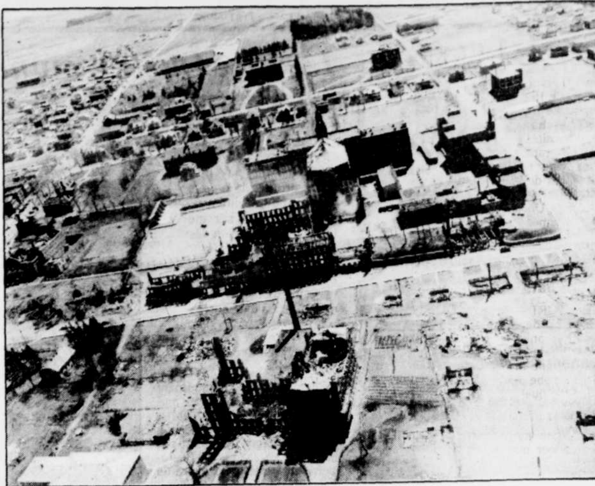
Notre reporter à Rimouski avait 12 ans en 1950 lorsqu'il a été témoin de l'incendie qui a ravagé sa ville.