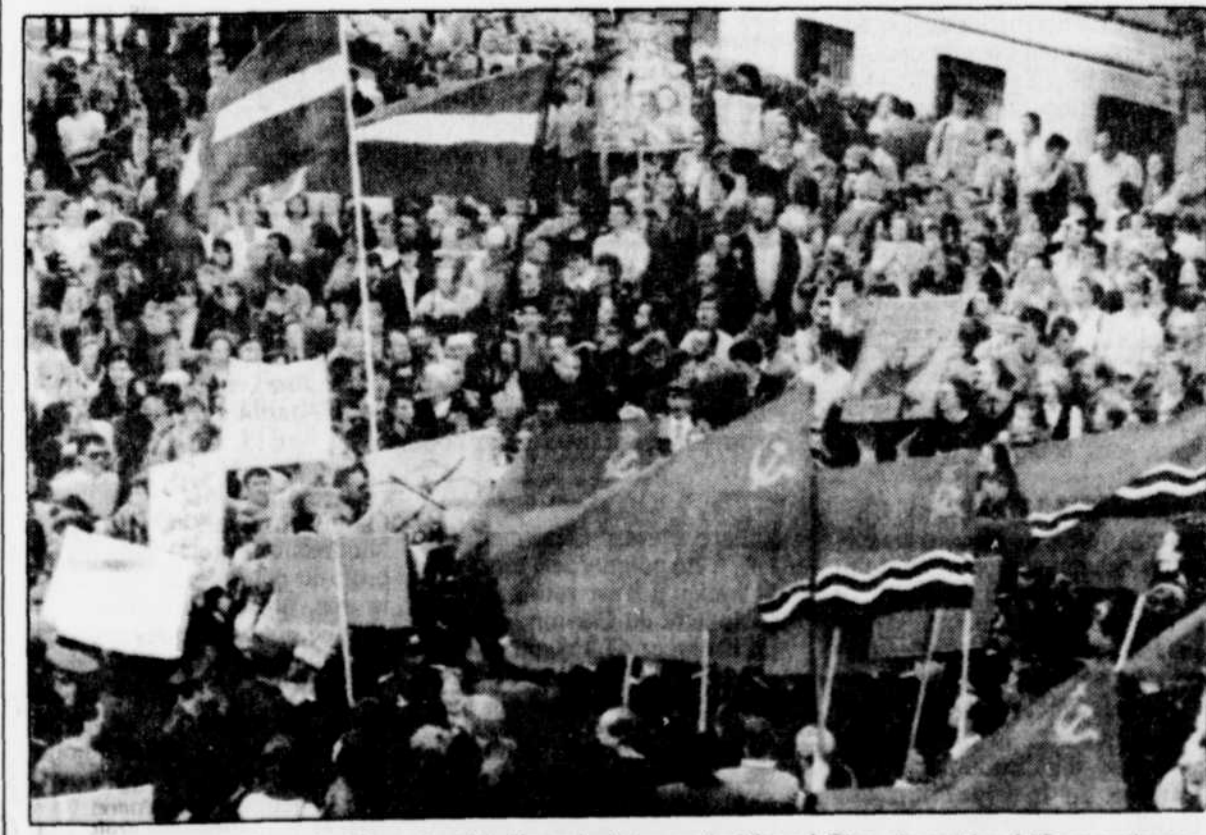
Des manifestants indépendantistes et anti-indépendantistes se font face à Riga, devant les édifices parlementaires peu avant que les députés ne restaurent la République de Lettonie.