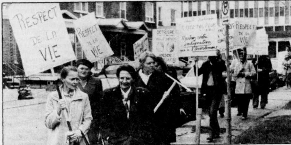
Pancartes en main, une centaine de paroissiens de Saint-François-d'Assise ont marché hier devant l'hôpital du même nom pour manifester leur désaccord au service d'interruption de grossesse mis sur pied par l'établissement il y a trois ans.

Une fois mis au fait de la situation, les citoyens n'ont ce-