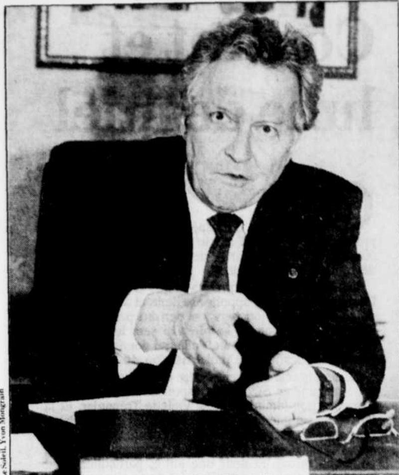
« Les démocrates doivent accepter le verdict de la démocratie. »

Jusqu'ici, il perçoit de façon positive, les rapports du gouvernement québécois avec la ville. Cependant, se hâte d'ajouter le maire, en raison de ses problèmes actuels, il a bien d'autres