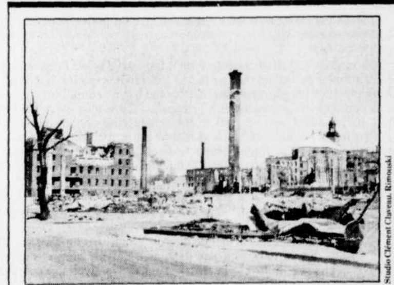
Ce qu'il restait, le 7 mai 1950 de l'orphelinat des Soeurs de la Charité et du petit séminaire.