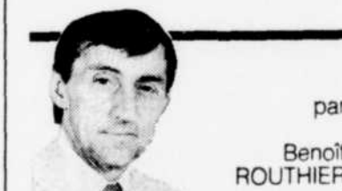
par Benoît ROUTHIER

Les maires de la Communauté urbaine de Québec (CUQ) conservent l'opinion qu'ils avaient du nouveau maire Jean-Paul L'Allier, au lendemain des élections: un homme voué à la collaboration, à la conciliation et à la concertation. On ne tarit pas d'éloges.