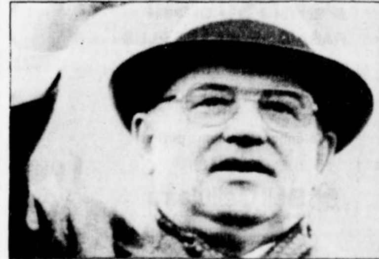
Mikhaïl Gorbatchev : adulé à l'étranger, méprisé chez lui.

En fait, ce que les Soviétiques ont dit à leurs dirigeants lors du défilé de la fête des travailleurs, c'est qu'ils en avaient ras-le-bol de vivre dans un pays du Tiers-monde. Car si la « glasnot » leur a fait redécouvrir leur âme, elle leur a aussi fait découvrir la profondeur de leur misère.