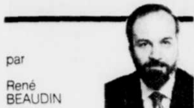
par René BEAUDIN

Étonnante dislocation que celle de l'Empire soviétique. Trois républiques ont fait sécession en quelques semaines et le gouvernement de Moscou réagit à peine. Ces sécessions il est vrai restent ambiguës.