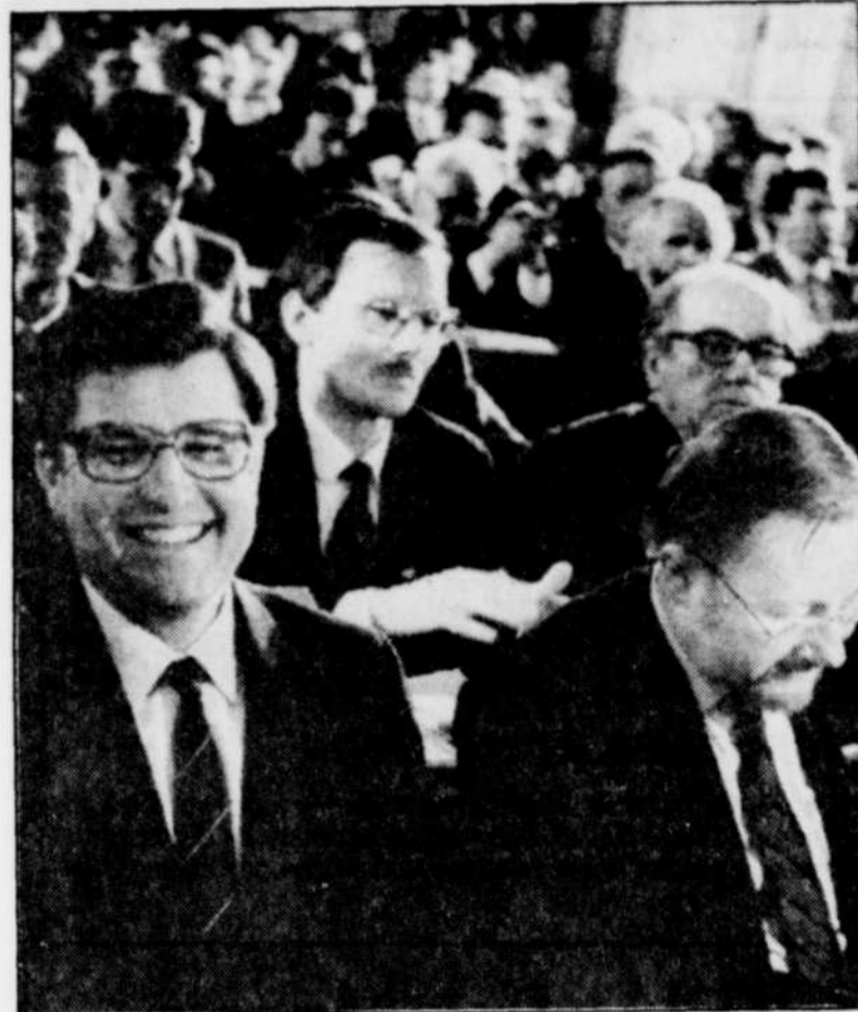
Le président de la Lettonie, M. Anatoly Gorbunov, le président de la Lettonie, jubile après la proclamation de l'indépendance. Son homologue lituanien, M. Vytautas Landsbergis, est à ses côtés en ce moment historique.

Un sondage récent révèle que le pourcentage des Soviétiques refusant toute confiance au Parti