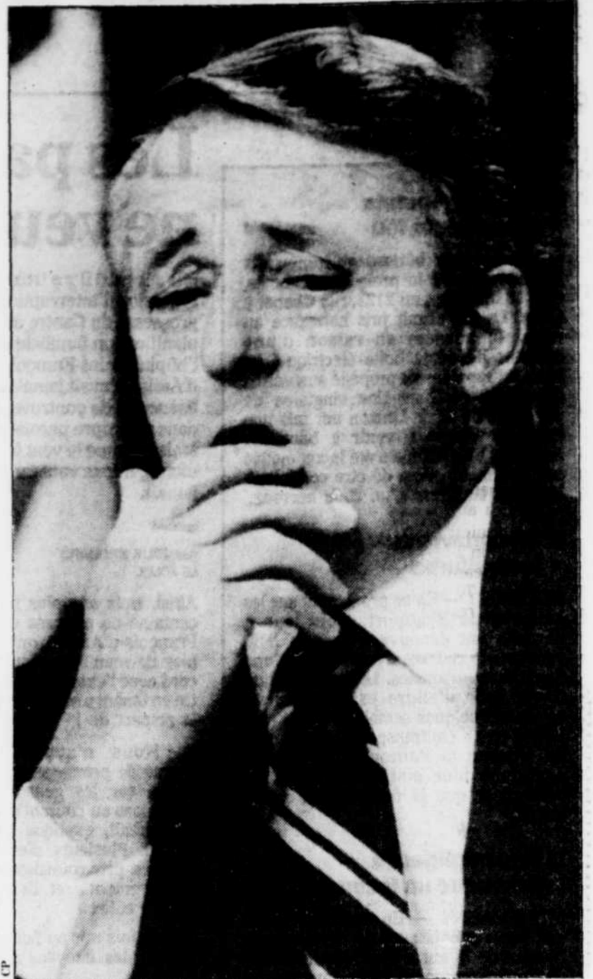
Les trois quarts des Québécois sont insatisfaits du gouvernement de Brian Mulroney.

Le président de la CSN trouve qu'il y a un problème de démocratie lorsque l'État joue ainsi un rôle de législateur pour se satisfaire comme employeur.