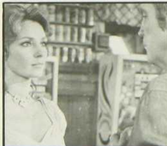
«Des nerfs d'acier»

Un film pour les amateurs d'action «virile» qui n'aiment pas se poser de questions, dit la critique. Le récit se situe dans un milieu peu exploité au cinéma, souligne encore la critique, ce qui nous vaut une documentation intéressante sur les immeubles en structure d'acier.