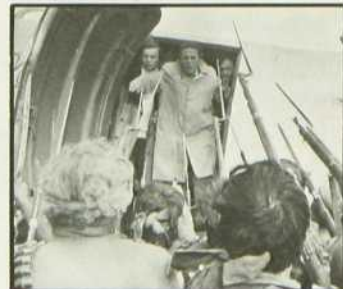
«Les Horizons perdus»

Le roman utopique de James Hilton fut déjà porté à l'écran en 1937 par Frank Capra et ce, avec un brillant succès. On dit que cette nouvelle version témoigne de la nostalgie d'un paradis perdu.