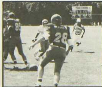
«La Grande Mêlée»

On dit que le scénario de ce film fut inspiré par un fait réel et que cette partie de football entre Freaks et Pigs a lieu tous les ans.