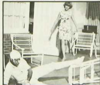
«Bébert et l'omnibus»