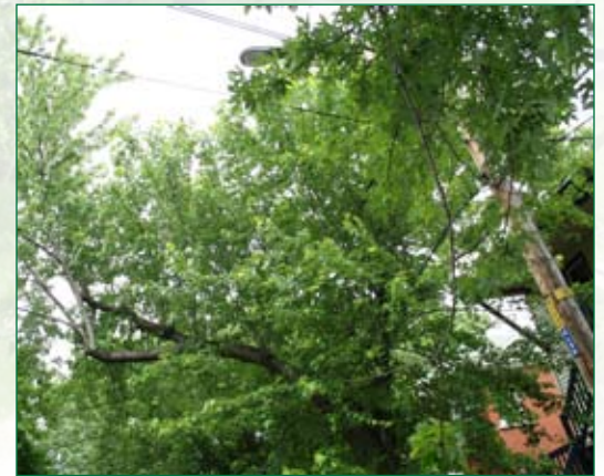
Voici deux exemples de plantation aux résultats opposés. Le premier arbre est bien localisé, tandis que le second amènera des problèmes tôt ou tard.