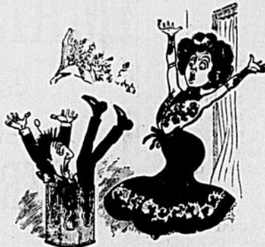
V — Aie! Aie! Ciel!