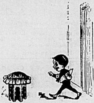
I TOTO. — Ma sœur attend son cavalier. On va rire.