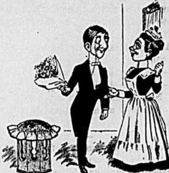
III LA SERVANTE. — Si monsieur veut passer au salon, mademoiselle va descendre à l'instant.