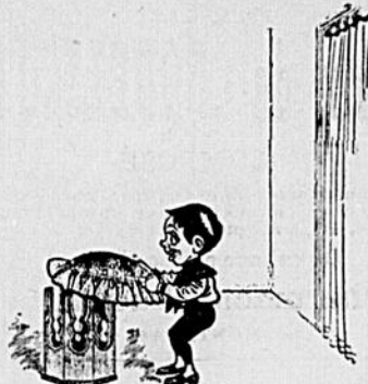
II Je vais mettre le tabouret.