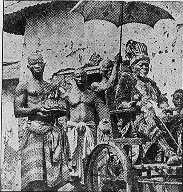
Le vieux monarque noir porte encore le costume royal. Il a perdu un peu de sa fortune aux mains de certains adversaires, mais il conserve encore le respect de ses sujets.

Depuis ce temps quelques villages et royaumes de la côte voient passer, graves dans leur élégance un peu extravagante... les derniers rois noirs. Il y a les tout-petits, ceux qui se font une gloire d'être coiffés d'un casque de pompier, généralement usagé, importé d'on ne sait où. Il y a encore des potentats absolus, maîtres de la vie de leurs sujets et dont les actes échappent encore au contrôle des puissances qui possèdent des colonies en Afrique. Cependant du plus petit au