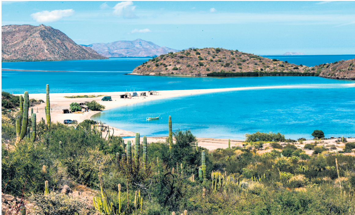
La magnifique mer de Cortés. Partout sur la côte, des excursions en bateau permettent d'explorer une myriade d'îles.