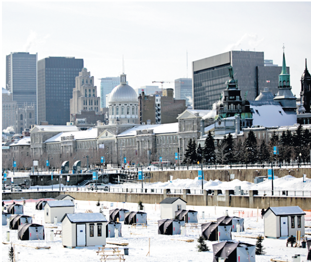
La pêche blanche dans le Vieux-Port. La ligne d'horizon de la ville de Montréal en arrière-plan.