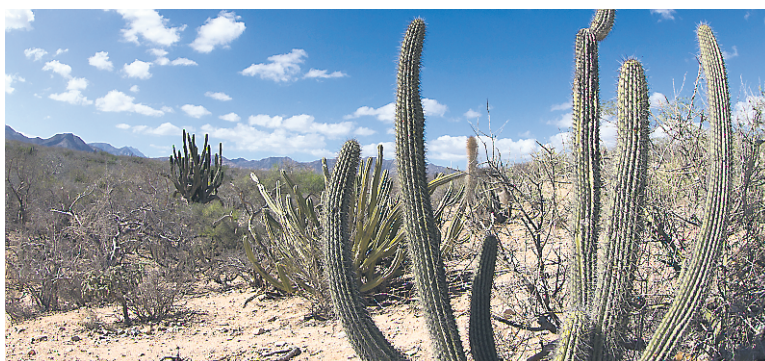
La Basse-Californie offre des paysages insolites.

Loreto, les pêcheurs vous emmènent dans leurs barques, à l'aube, lorsque le ciel déroule ses déclinaisons de rose sur les derniers reliefs de la sierra Giganta qui se jettent dans la mer. Outre les nombreux dauphins, on peut s'approcher des baleines bleues, qui migrent dans ces eaux chaudes en hiver. Une escale aux îles Coronado permet d'observer des colonies d'oiseaux et d'otaries. Loreto est aussi un haut lieu de la pêche sportive.