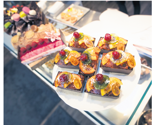
À la Maison Christian Faure, une ambiance parisienne qui fait tout le charme de l'endroit, et des pâtisseries françaises classiques pour le dessert.