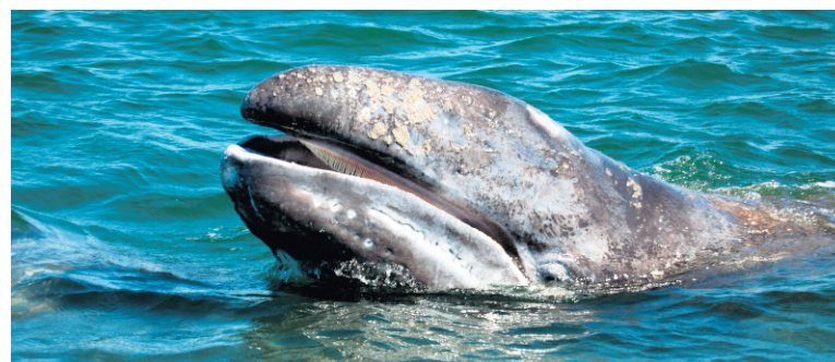
La lagune de San Ignacio est le principal sanctuaire de baleines grises en hiver. Les excursions organisées par les associations écologistes de la région veillent scrupuleusement à ne pas perturber ces cétacés, qui s'approchent des barques et se laissent caresser par les touristes.

San Francisco peuvent être découvertes au départ de San Ignacio. Il existe plusieurs sites : les grottes de La Pintada, Las Flechas, Los Mœsicos, La Soledad, Boca San Julio et Cuesta Palmarito, certaines accessibles en voiture et d'autres, à dos de mule, le long du lit des canyons. L'histoire de ces peintures, qui représentent des figures humaines et animales, reste mystérieuse. Les habitants du village de San Francisco de la Sierra sont formés pour guider les visiteurs. Au retour, la route, scintillante dans le contre-jour, serpente à l'infini sur les crêtes dégingolantes de la sierra. Un conseil : vérifiez l'état de vos pneus avant d'entreprendre une excursion dans la sierra, où les routes non asphaltées sont parfois rocailleuses.