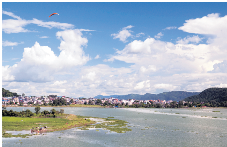
Un parapente survole le lac Phewa, l'emblème de Pokhara.

Avant de passer à table, on ira bien relaxer un peu! C'est aussi ça, Pokhara. Un endroit où les gens reviennent épuisés des grands treks de la région, comme le circuit de l'Annapurna, l'une des randonnées les plus populaires au Népal. Il y a un nombre incalculable de centres de yoga, de méditation ou de massage. On y retrouve d'ailleurs d'autres entreprises sociales, comme ces salons de massage où les soins sont prodigués par des aveugles ou des sourds.