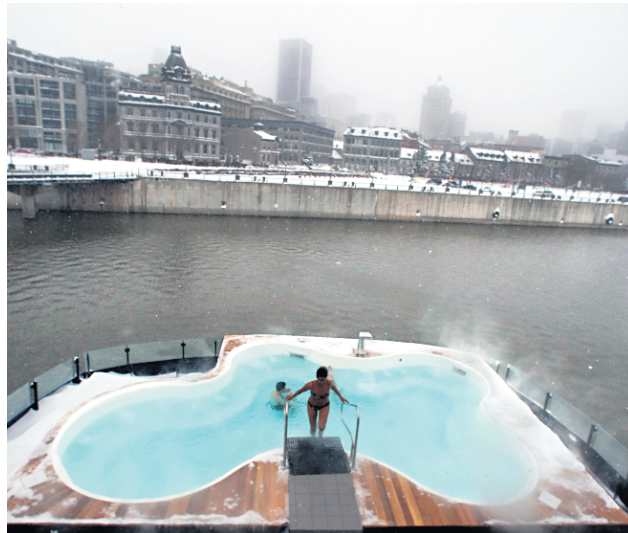
Les clients du spa Bota Bota dans le Vieux- Montréal ont bravé la tempête et le vent glacé du fleuve.