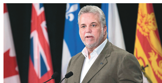
ANDREW VAUGHAN LA PRESSE CANADIENNE

L'usage des fonds dégelés inquiète Israël et les monarchies sunnites du Golfe, mais Téhéran affirme que l'argent ira à la relance de l'économie.