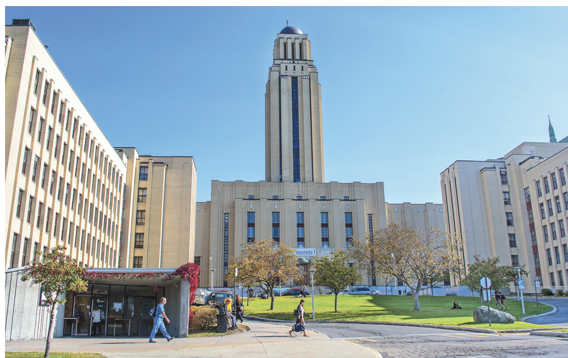
MICHAËL MONNIER LE DEVOIR

C'est que l'ombudsman reçoit dans son bureau les étudiants qui ne savent plus à quelle ressource s'adresser. Un cas type? « Un étudiant qui