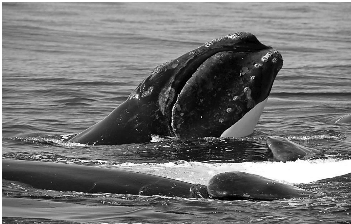
La carcasse repérée près des îles de la Madeleine a été identifiée comme étant celle de la baleine baptisée n° 3923 par l'aquarium de New England, une jeune femelle âgée de six ans (notre photo).

a procédé à une modélisation afin d'établir la trajectoire que suivra probablement la carcasse. Selon les prévisions du groupe, la baleine devrait finir par s'échouer sur les côtes des îles de la Madeleine. « Le plan sera alors de prélever des échantillons et de documenter visuellement le décès », ajoute la spécialiste de l'observation de ces animaux.