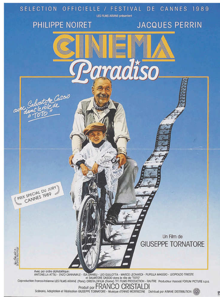
Affiche originale de Cinéma Paradiso , du réalisateur italien Giuseppe Tornatore

Bref, c'est un film qu'on regarde comme un vieil album photo. C'est chaleureux, touchant et réconfortant. La dernière scène, fameuse, où le hé-