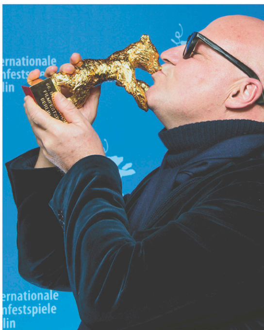
Gianfranco Rosi, réalisateur de Fuocoammare , après avoir reçu son prix