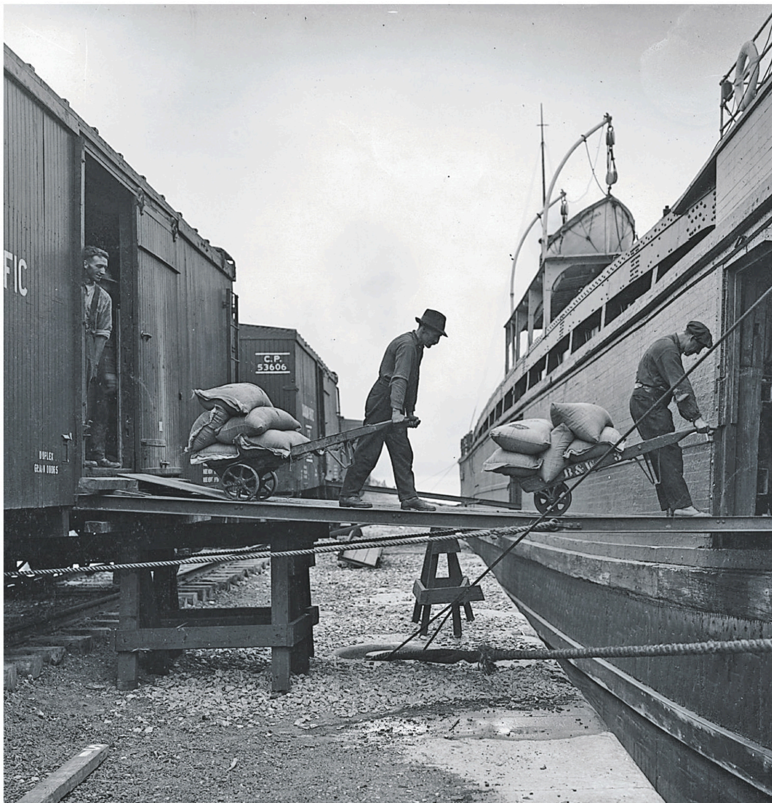
Chargement de sacs de grains au port de Montréal, vers 1920

Cela s'explique entre autres par le fait que VIA Rail Canada, la société d'État qui assure maintenant le transport des passagers en train au pays, n'a été créée qu'en 1977. Elle n'a jamais été propriétaire des rails qu'elle emprunte. Encore aujourd'hui, le transporteur paie un droit de passage au Canadien Pacifique et au Canadien National, les deux compagnies qui possèdent la majorité des lignes au pays. La société d'État entretient cependant le rêve de déployer un nouveau réseau de voies réservées