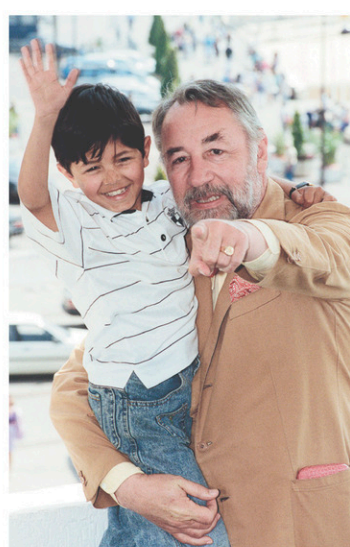
Philippe Noiret et le jeune acteur italien Salvatore Cascio à Cannes en 1989

Tous deux réalisés par Vincente Minnelli et mettant en vedette Kirk Douglas, Les enroulés (plus connu sous le titre The Bad and the Beautiful ), sur les souvenirs aigres qu'une actrice, un réalisateur et un scénariste gardent d'un producteur ambitieux, et Quinze