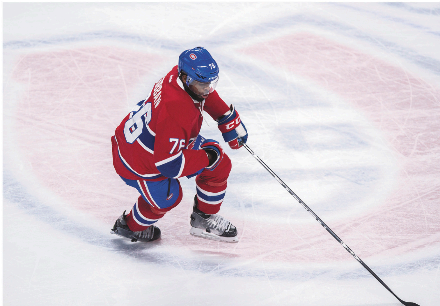
P. K. Subban peut dormir en paix, les partisans de l'équipe l'apprécient.