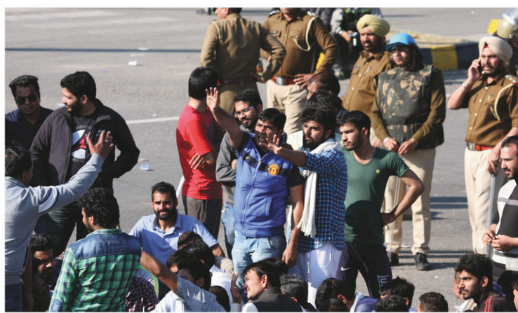
Des Jats bloquent l'autoroute reliant Chandigarh à Shimla.

Des pourparlers ont eu lieu à New Delhi dimanche soir entre le ministre de l'Intérieur Rajnath Singh, le parti au pouvoir (BJP) dans l'État de Haryana, théâtre de cette crise, et les dirigeants des Jats.