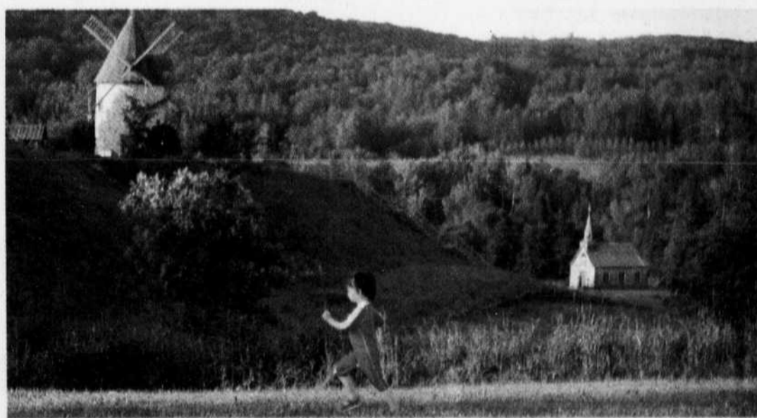
Le splendide site du Baluchon a servi au tournage de la série Marguerite Volant .

C'est aussi à Bryan Perro qu'on doit l'écriture d' Eclips , un amalgame de musique, d'acrobaties, de