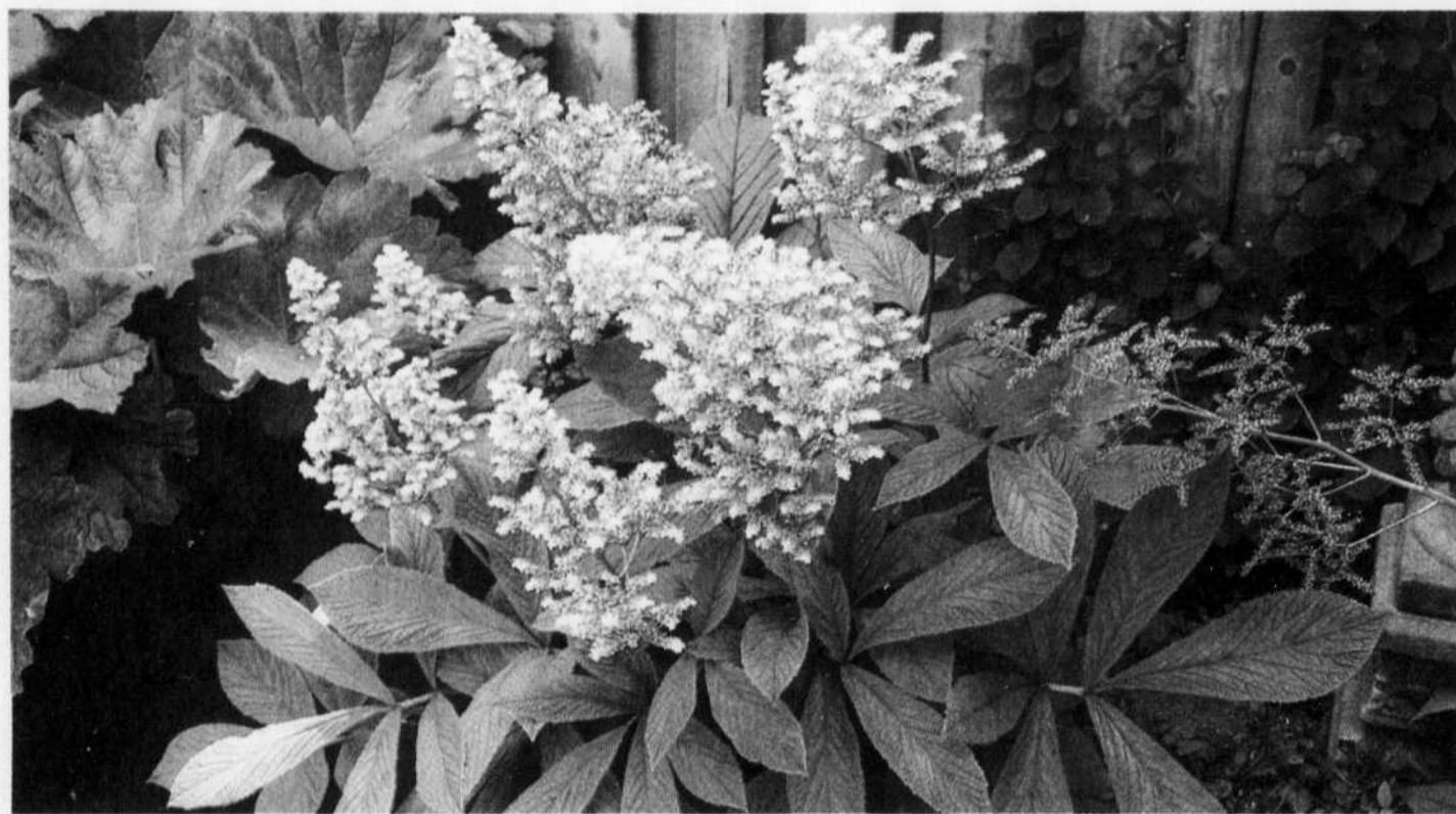
Magnifique Rodgersia , croqué dans un jardin secret de Rosemère