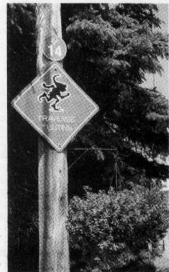
La traverse de lutins de Saint-Élie-de-Caxton