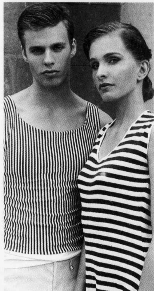
MICHAEL DAVANTES AGENCE BELLE MUNDO «Nous habillons pour l'après-tennis. Il faut rehausser la personnalité de chacun, ce n'est donc pas une collection avec un thème; on fait un défilé avec des pièces uniques et colorées.»