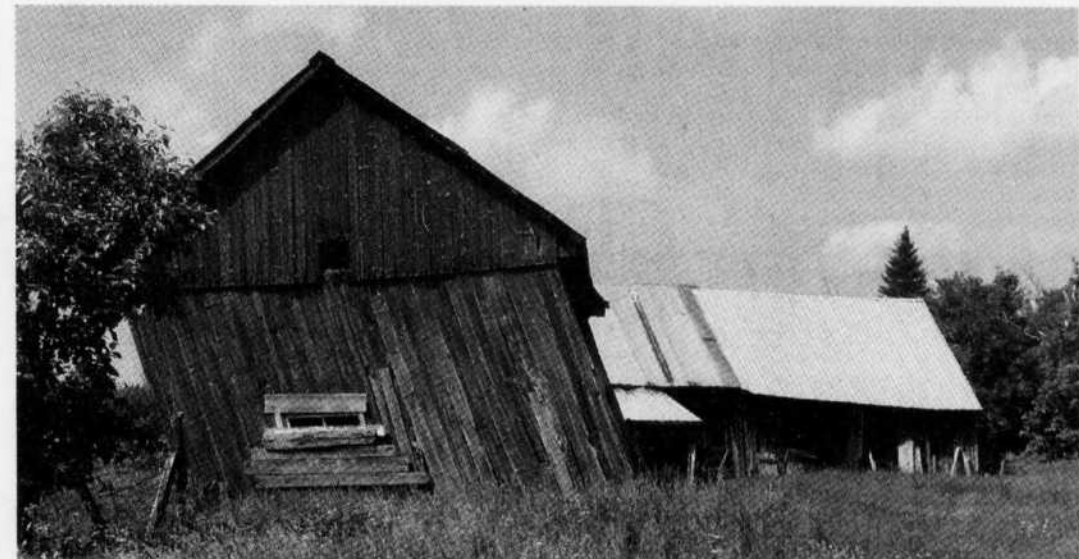
Une grange penchée à Saint-Paulin