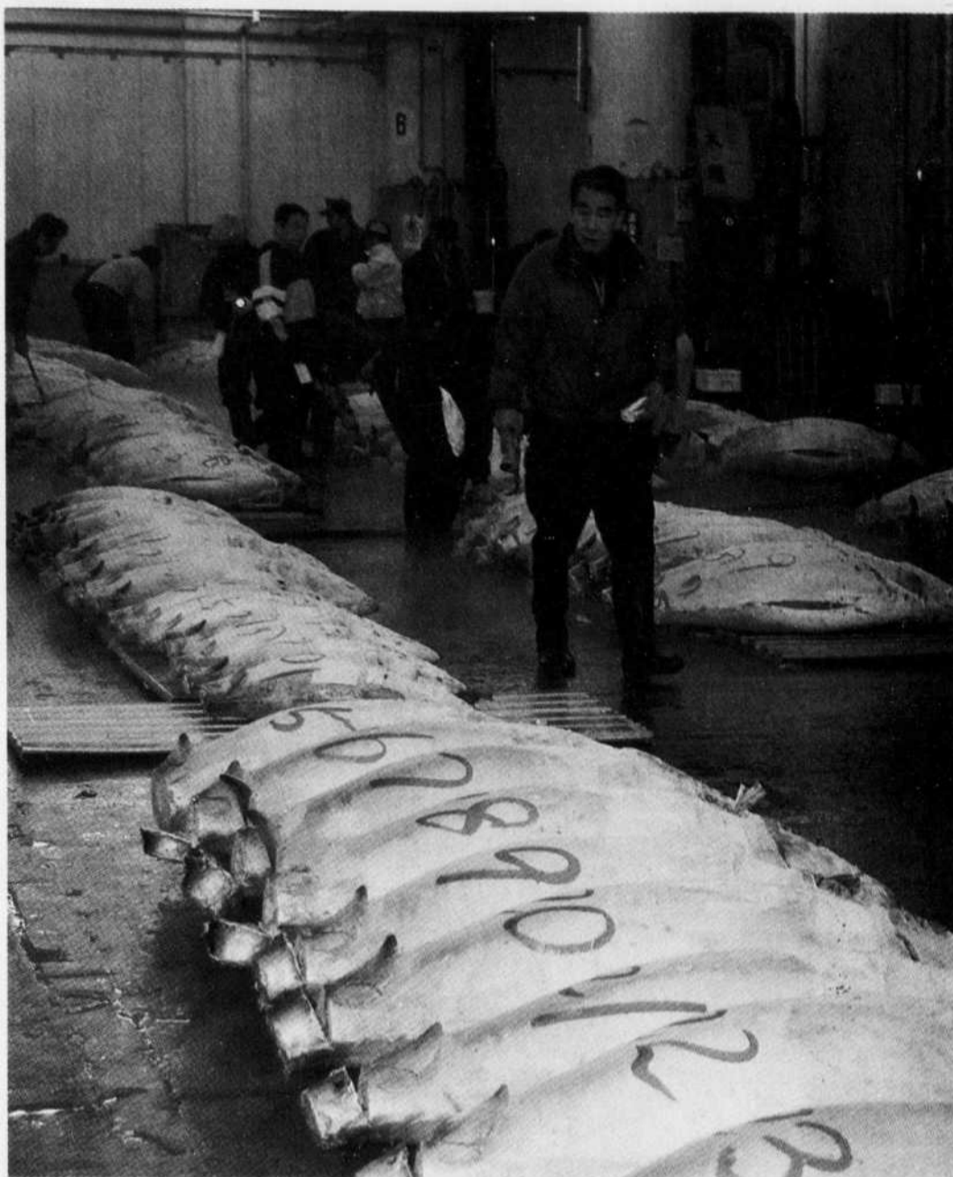
Au marché de Tokyo, il faut voir l'effervescence que crée la vente des thonidés, et la ruée des acheteurs qui n'hésitent pas à traverser le Japon à la recherche de la pièce rare.

en garde contre la pêche ou la consommation de certaines espèces des fleuves et des océans. Une réserve naturelle est maltraitée lorsque celle-ci subit des agressions de l'homme qui y déverse, par exemple, des hydrocarbures ou d'autres déchets toxiques. De fait, les poissons des pauvres sont, comme bon nombre d'aliments, désormais réservés, en raison de leur prix, à une clientèle bien nantie qui peut se permettre de payer jusqu'à 100 $ le kilo de thon bleu sans que cela n'affecte leur portefeuille. Des produits jadis accessibles comme la lotte, la raie, le hareng ou la sardine disparaissent petit à petit. Ces variétés deviendront rares et par conséquent, plus dispendieuses. Comment faire puisque le poisson et les éléments nutritifs qu'il