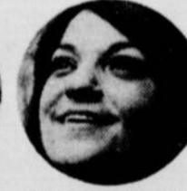
FRIDA BOCCARA 1 er AVRIL

Un véritable gala d'artistes chaque samedi soir, du 15 janvier au 1 er avril. Deux représentations à 8:30 heures et 10:30 heures p.m. Pour une soirée inoubliable, le Chantecler vous propose également son Buffet-Dansant du samedi soir. Dégustez un fin buffet chaud et froid et dansez aux airs