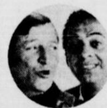
LES JÉROLAS 29 JANVIER