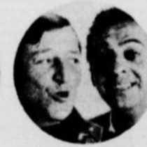
LES JÉROLAS 25 MARS