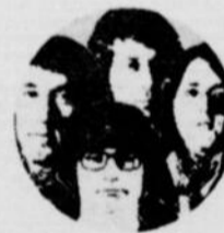
LES CYNIQUES 19 FÉVRIER