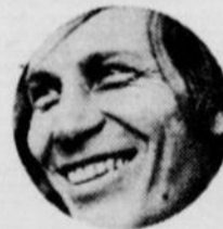
JEAN-PIERRE FERLAND 11 MARS