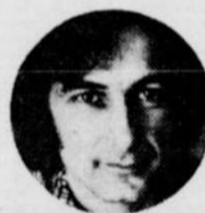
YVON DESCHAMPS 22 JANVIER