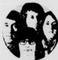
LES CYNIQUES 12 FÉVRIER