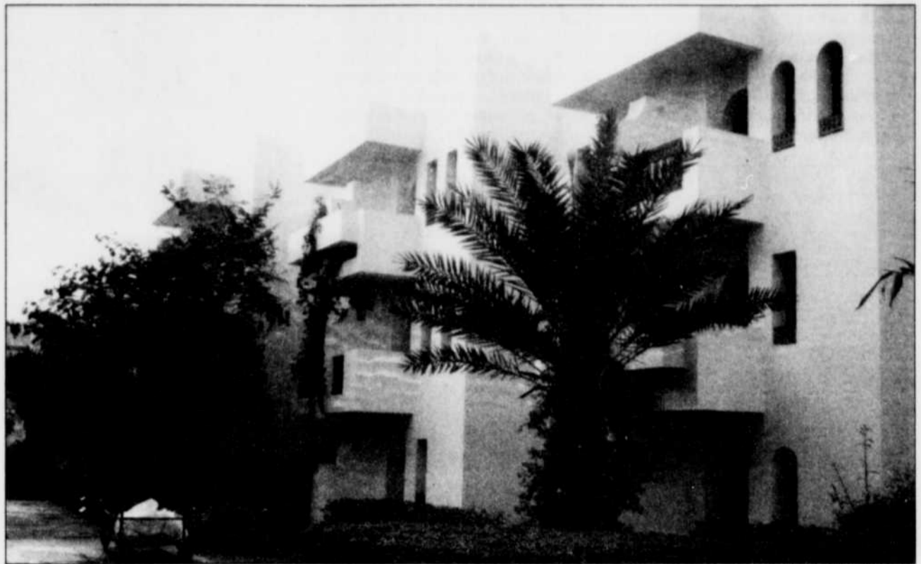
Un édifice du Club Med.

Les boutiques sont nombreuses et les marchands de troittoir encore plus.