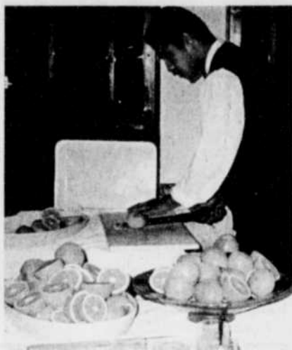
Clémentines, oranges, pamplemousses roses, etc., sont portés par millions de tonnes, via le port d'Agadir. Il y en avait aussi au Club Valtur. Tous les jours, pour le petit déjeuner. Frais et délicieux. Le groom en tranchait des centaines tous les matins... à la santé de tous les clients.

Mais la limite est la même dans un autre club. La formule tout inclus devient souvent indigeste lorsque, sous prétexte que tous les repas sont inclus, vous ne sortez pas en ville, un soir ou deux, pour vous changer le goût, pour varier la présentation, pour raviver le plaisir des yeux et des papilles gustatives.