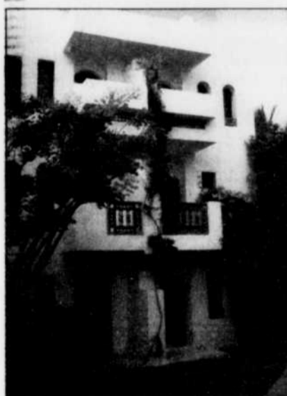
Que de fleurs: Les jardins du Club Valtur d'Agadir sont exceptionnels. La végétation est luxuriante. Les fleurs s'agrippent après tout ce qu'elles trouvent. Elles s'enroulent autour des troncs des arbres, elle escaladent les murs des habitations.

Bellissimo Morocco! Elegantissima villagi Valtur (Valorisation Turistica)! La grandi occasioni di una vacanza. Bon, voilà! La traduction è facilité. Le Maroc est italien.