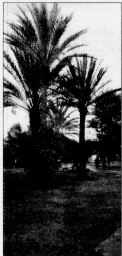
LE SOLEIL, PIERRE CHAMPAGNE

Mais ce négoce est partie de la mentalité nord-africaine. Vous divisez le premier prix par trois et vous bougez à peine. C'est la règle. Il y en a qui aiment. Moi je déteste!