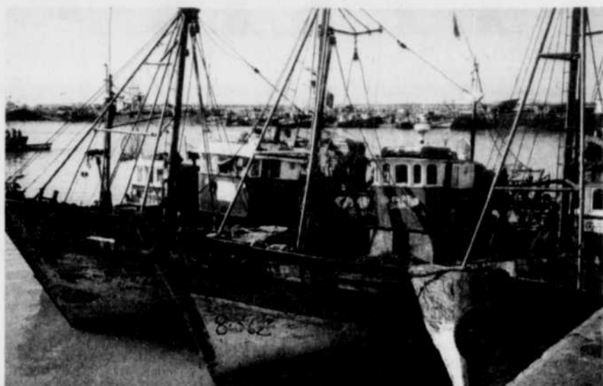
Collés les uns sur les autres comme pour se réchauffer, les sardiens sont nombreux dans le port d'Agadir, l'un des plus importants du pays. Tous les matins, l'activité est fébrile dans les hangars. Le marché du poisson est devenu même une attraction touristique de premier ordre.

L'architecture du club est typiquement marocaine. Impressionnante! L'aménagement paysager est à faire rêver. Les fleurs de toutes les couleurs grimpent aux palmiers pour les rendre encore plus exotiques. Même les conifères, fort différents des nô-