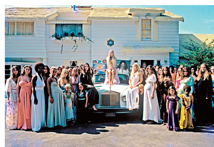
La Source Family était autrefois très en vogue sur Sunset Boulevard grâce à son restaurant de cuisine santé.