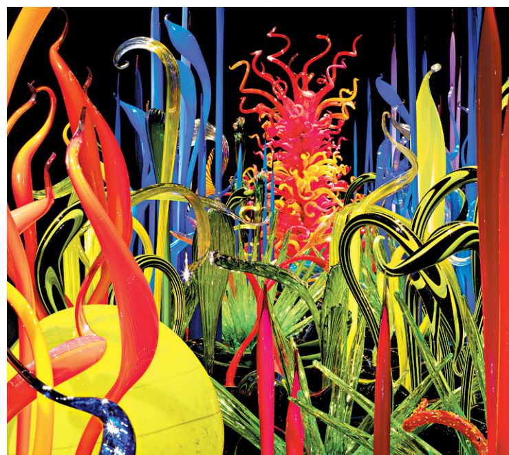
Dale Chihuly, Mille Fiori , 2008.

Peu connu ici, Chihuly est un phénomène en soi. Artiste multimillionnaire aux commandes d'une machine toute dévouée à son imagination débordante, le personnage à la tête de corsaire a survécu à une collision frontale qui lui a coûté un œil, en 1976, et à un accident de surf qui l'oblige depuis 30 ans à s'entourer d'assistants pour mener à bien ses projets grandioses. C'est accompagné de sa petite armée que ce pionnier du mouvement Studio Glass a mis le pied à Montréal à l'automne 2012, à l'invitation de Nathalie Bondil, pour préparer plusieurs installations monumentales taillées sur mesure