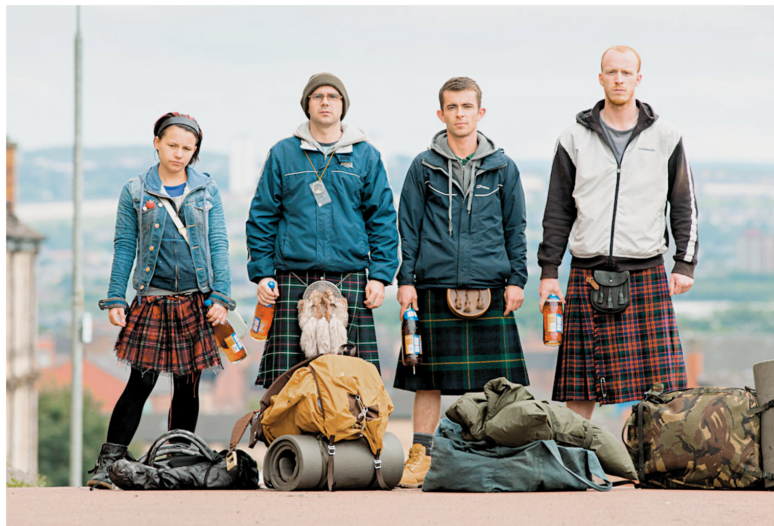
Une scène de The Angels' Share . Dans le monde du vin et des spiritueux, la part des anges est le nom donné à la perte occasionnée par leurs vieillissement en fûts de chêne.

Loach et Laverty auraient pu opposer de façon manichéenne les possédants, qui méditent sur les vertus d'un single malt , et les possédés, qui pourraient payer trois ans de loyer avec le prix d'un