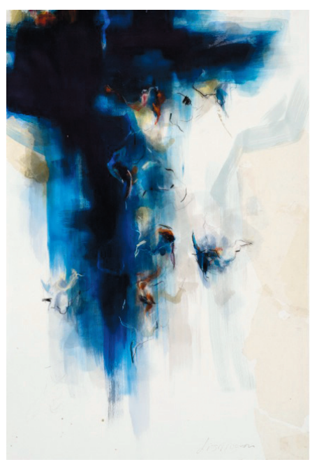
Catarata, 2013, tech. mixtes, 112x76 ou 44x30 po.

1049, AVENUE DES ÉRABLES QUÉBEC (418) 525-8393 www.galerielindaverge.ca