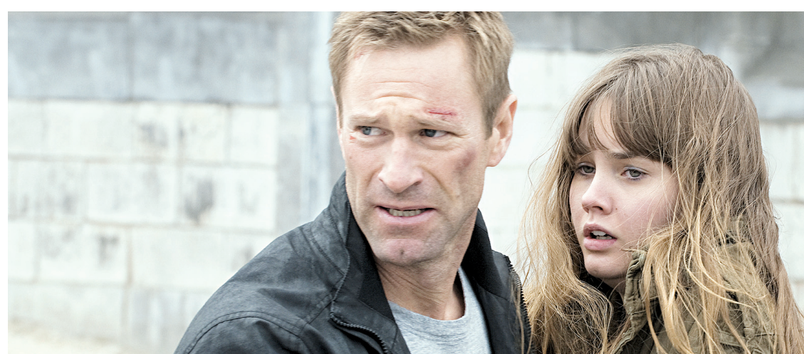
Un ancien agent de la CIA traqué et sa fille interprétés par Aaron Eckhart et Liana Liberato.