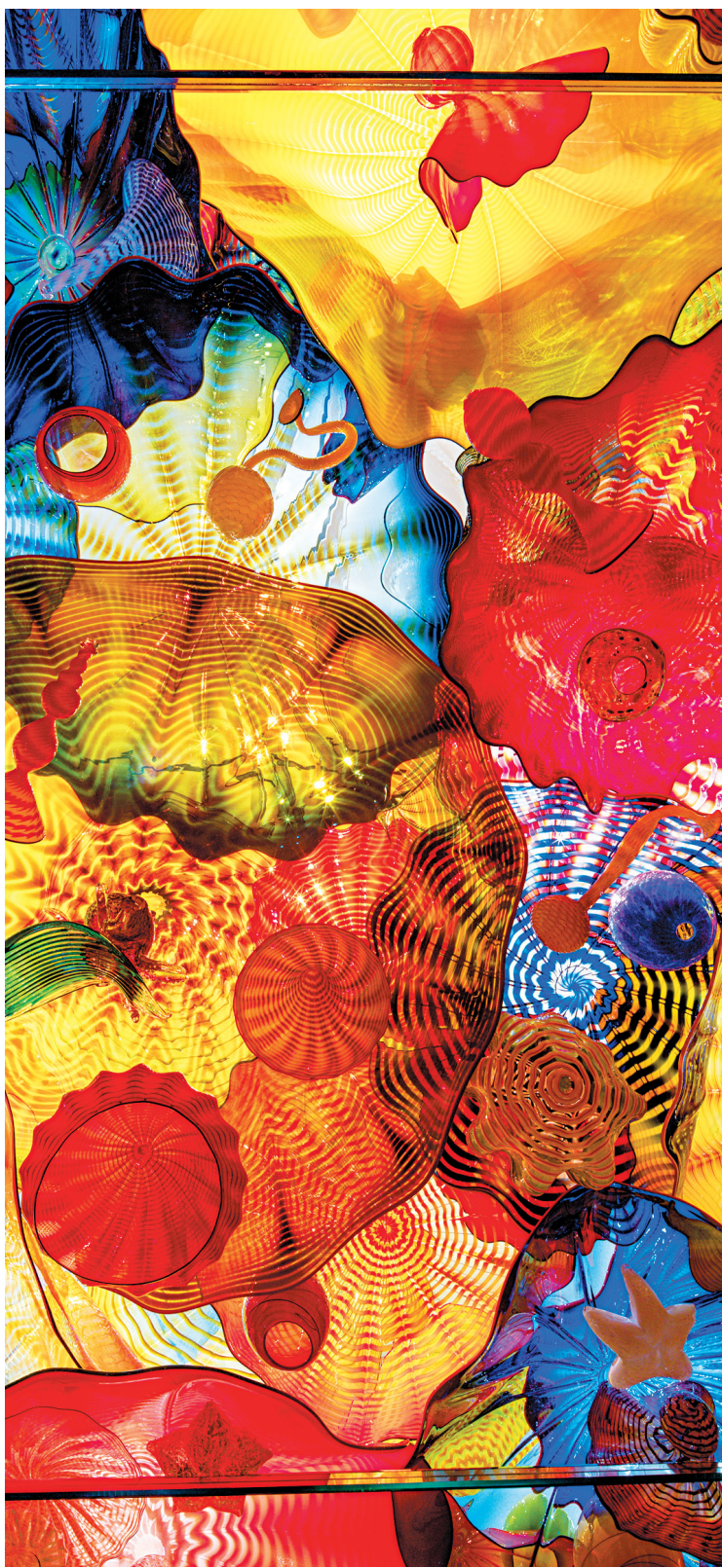
Dale Chihuly, Plafond persan (détail) , 2012.