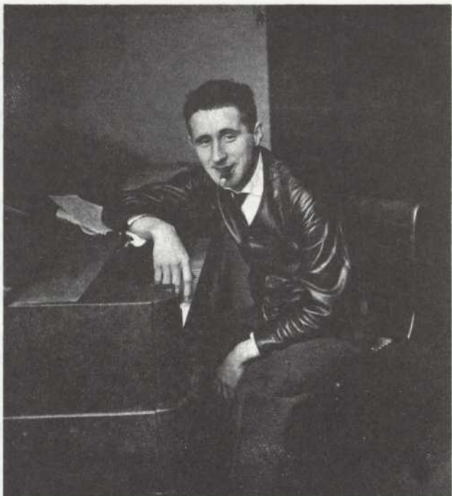
Bertolt Brecht (1928).

Brecht fumait le cigare sans discontinuer. Il commençait dès les premières heures du jour. "Sans cigares, je ne peux pas travailler, je ne peux pas penser", me déclara-t-il un jour, "les cigares sont un outil aussi nécessaire à mon métier que la machine à écrire et le papier". Mais il aimait les cigares bon marché. Quand nous étions tous deux en exil en Amérique, il en fumait sans arrêt, de la marque la moins chère: le fameux cigare à 5 cents. Un jour que de riches admirateurs habitant Hollywood venaient de lui offrir à Noël un coffret de luxueux havanes, il les accepta en remerciant, les posa à une place d'honneur... et continua à souffler au nez trop gâté de ces riches donateurs la fumée d'un cigare du prix le plus bas.