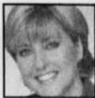
Pascale Nadeau Radio-Canada