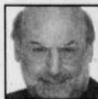
René Homier-Roy Radio-Canada