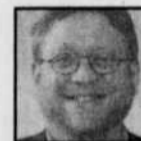
Jean Dion Le Devoir

VOUS INVITENT À VENIR DÉPOSER DES DONS EN ARGENT ET DES DENRÉES NON PÉRISSABLES À CES POINTS DE COLLECTE :