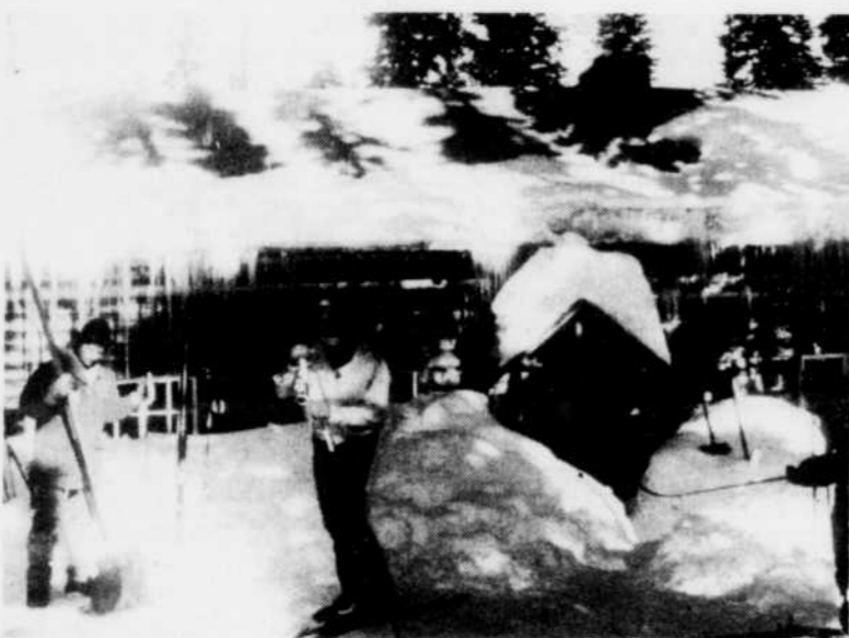
Whistler: un centre de ski pour le jet-set B 7