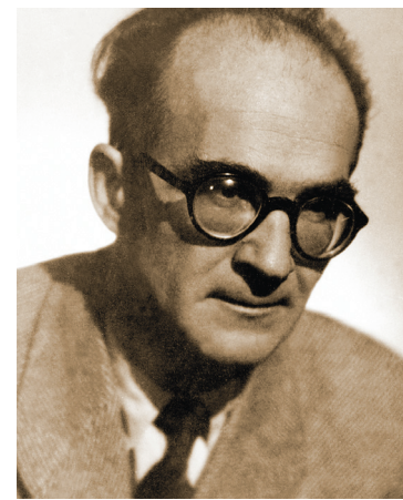
Photo non datée de l'écrivain français d'origine roumaine Mircea Eliade.

À l'image des naissances qui ne se font pas sans douleur, ne faut-il pas, pour renaître, mourir périodiquement à certaines choses? Aucun doute, dirait Eliade, même que les désastres figurent parmi les derniers rites de passage qu'il nous reste; ils nous sortent brutalement de nos prises existentielles pour nous placer devant nous-mêmes, le Réel et quelque chose d'assez insupportable qu'on pourrait appeler