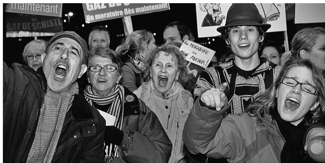
ANNIK MH DE CARUFEL LE DEVOIR

Les citoyens se sont mobilisés en 2010 sur les principaux dossiers environnementaux.