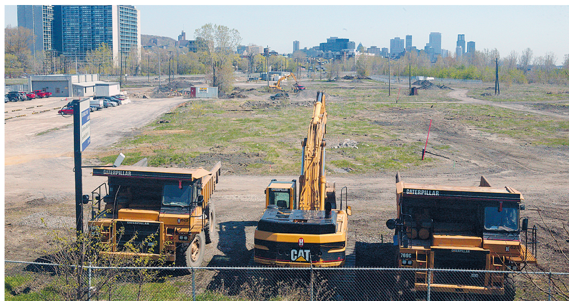
La cour Glen, où le CUSM est en construction

Mais pour les PPP, c'est une autre victoire. La prochaine étape: la sélection du partenaire au printemps.