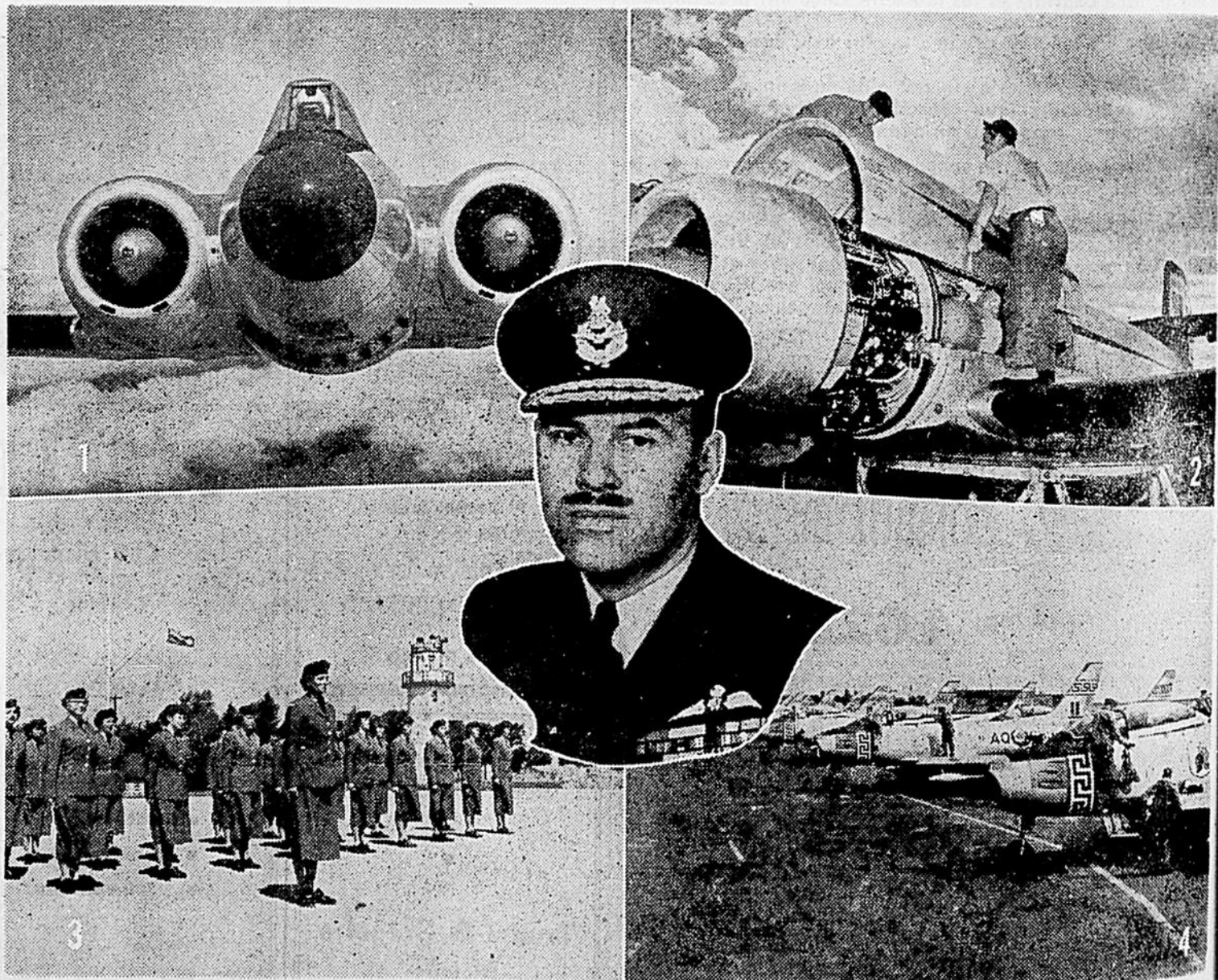
La Fête de l'Aviation fournit aux Canadiens l'occasion de visiter les stations du CARC et de se familiariser avec le travail de notre force aérienne. Cette année, le CARC poursuit un programme d'expansion qui éventuellement en fera une puissance mondiale munie des meilleurs avions et de l'outillage le plus perfectionné. Avec ses escadrilles en France, en Allemagne et en Angleterre, de même qu'au Canada, le CARC joue un rôle prépondérant dans l'épanouissement international de notre pays. En haut, à gauche, on voit le nez un peu inquiet du chasseur CF-100 (toutes températures). En haut à droite, des tech-

Une toux bronchique énervante vous empêche-t-elle de dormir? Le flegme est-il si épais dans vos bronches que la toux ne suffit pas à le détacher? Les capsules RAZ-MAH Templeton sont spécialement faites pour détacher le flegme, en permettre l'expulsion et vous soulager de cette toux et de ce sifflement. Achetez RAZ-MAH aujourd'hui. 65c, $1,35 toutes pharmacies. R-56F