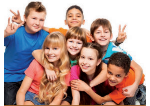
Les camps 13Actifs procurent beaucoup de plaisir, de nouveaux amis, en plus de permettre aux jeunes d'acquérir les habiletés motrices essentielles à la pratique d'activités physiques sportives.