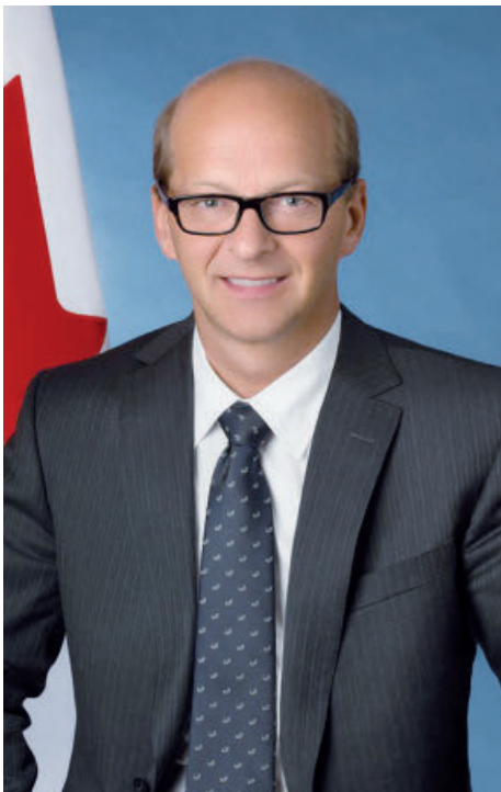
Claude Carignan est sénateur. Il fut maire de Saint-Eustache de 2000 à 2009.