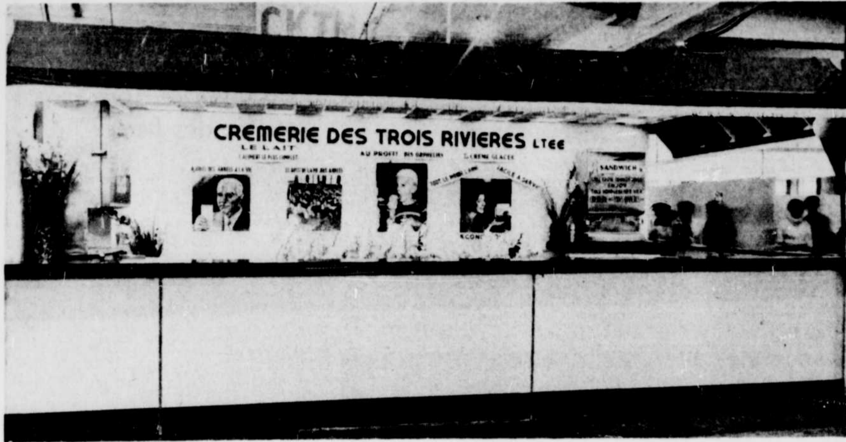
LORS DE VOTRE VISITE A L'EXPOSITION NE MANQUEZ PAS DE VOUS RENDRE AU KIOSQUE DE LA CREMERIE DES TROIS-RIVIERES LTEE ET DE DEGUSTER UNE DELICIEUSE CREME GLACEE. TOUT EN OBTENANT DES PRODUITS DE QUALITE, VOUS APPORTEREZ VOTRE AIDE AUX ORPHELINS, CAR TOUS LES PROFITS REALISES LEUR SERONT VERSES.