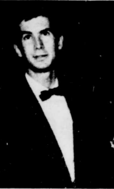
ANTHONY PERKINS (à gauche) et Audrey Hepburn (à droite) montrent leur "David", qui sont l'équivalent de l'"Oscar" en Italie. Ces statuettes leur furent présentées au festival du film de la Sicile. Perkins a été nommé le meilleur acteur étranger pour son rôle dans "Aimez-vous Brahms" et Mlle Hepburn a été désignée la meilleure actrice étrangère pour son rôle dans "Breakfast at Tiffany's".