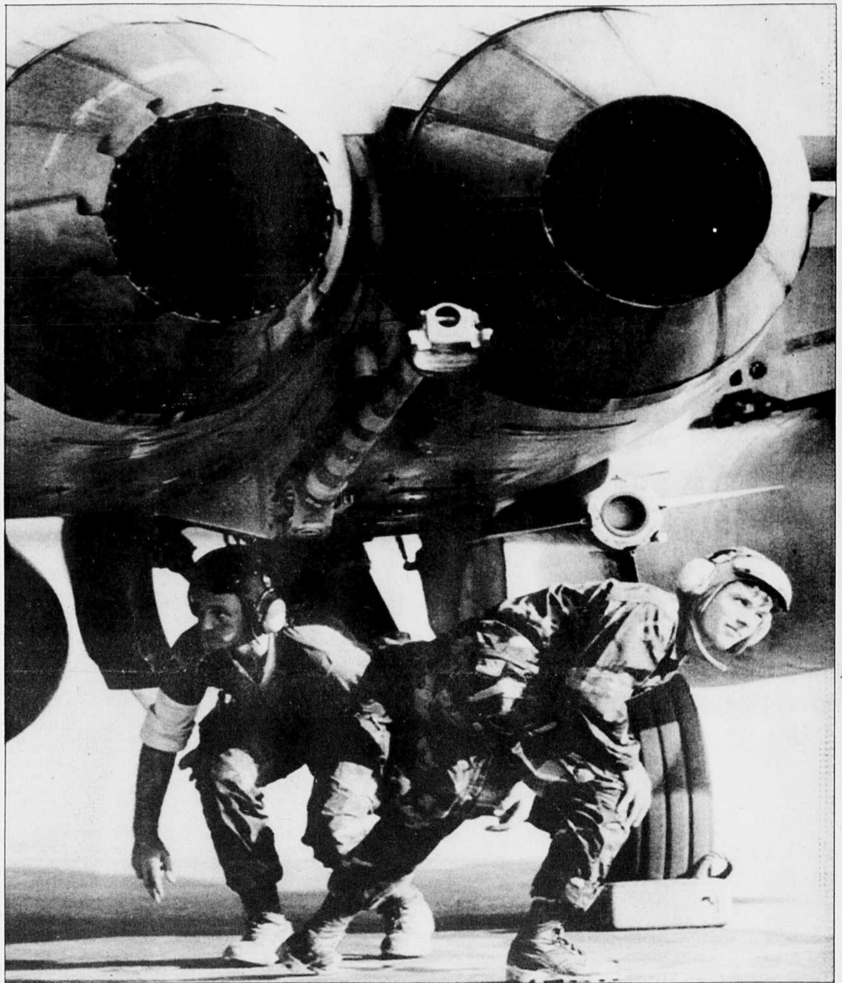
Les aviateurs de la force multinationale se préparaient depuis plusieurs jours en vue de l'assaut de la nuit dernière sur Bagdad. Ce Hornet F-18 américain est identique à ceux dépêchés par le Canada dans le Golfe.