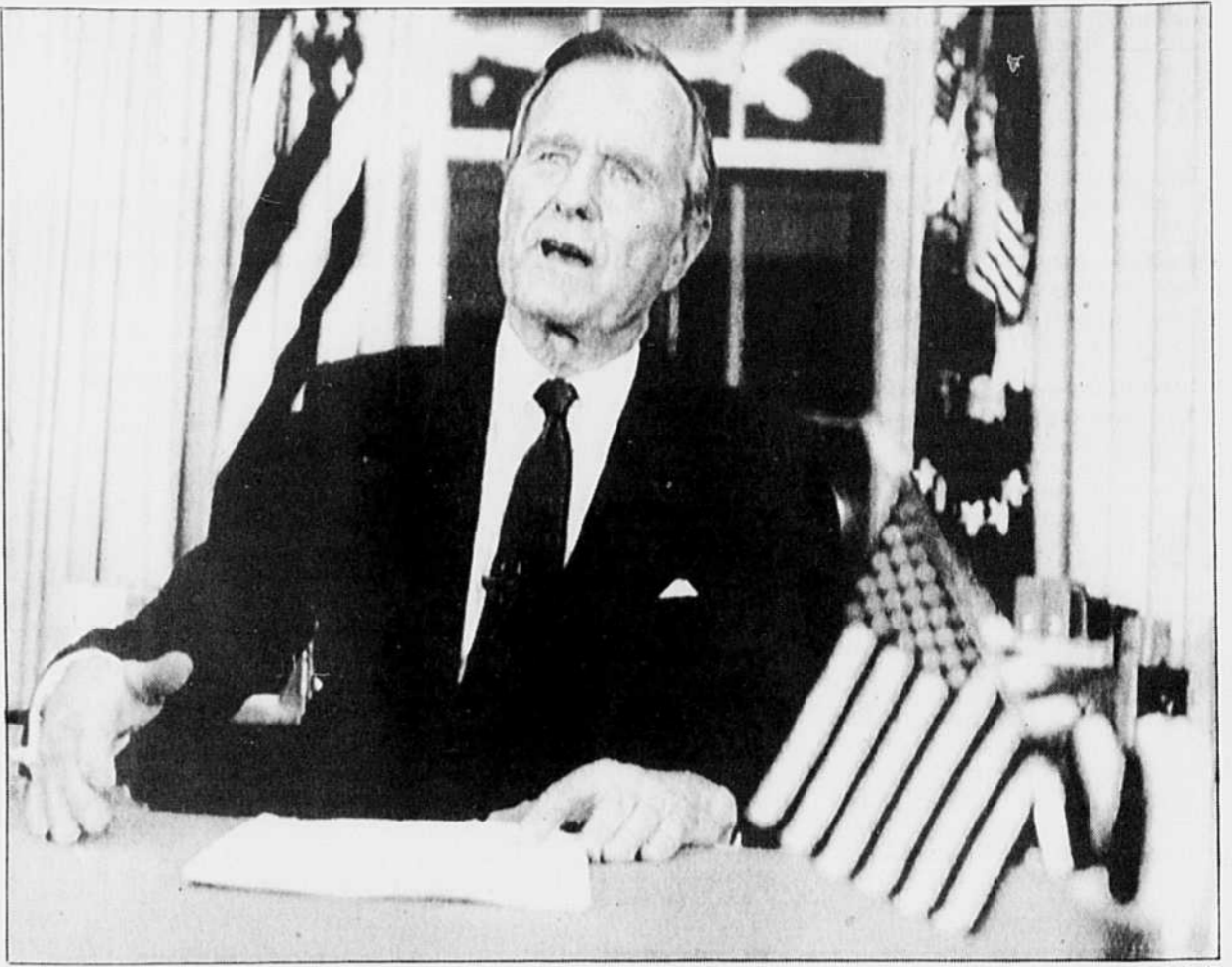
Le président George Bush a annoncé hier que les Etats-Unis étaient déterminés à éliminer le potentiel nucléaire de l'Irak ainsi que ses armes chimiques. « Nous sommes déterminés à détruire le potentiel nucléaire de Saddam Hussein », a déclaré le président dans une allocution de 14 minutes au peuple américain, diffusée de son bureau de la Maison-Blanche deux heures après le début de l'attaque des forces américaines et de la coalition contre l'Irak.

Dans l'après-midi, plusieurs milliers de manifestants proches, cette fois, du Parti communiste et du syndicat CGT, avaient également convergé vers la place de la République.