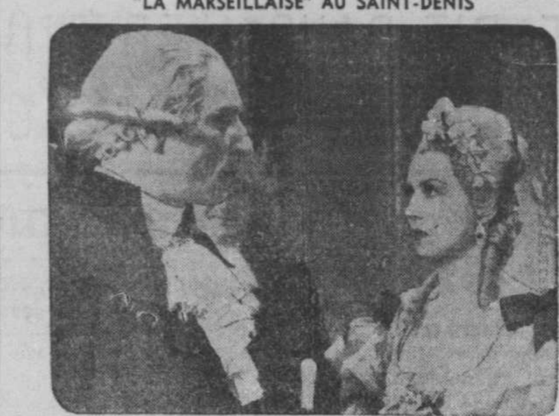
Louis Jovet et Lisa Delamarre dans une scène du film "La Marseillaise" qui prend l'affiche aujourd'hui au Saint-Denis.

Avez-vous besoin de bons livres? Adressez-vous au Service de Librairie du "DEVOIR" 430 rue Notre-Dame (est), Montréal.