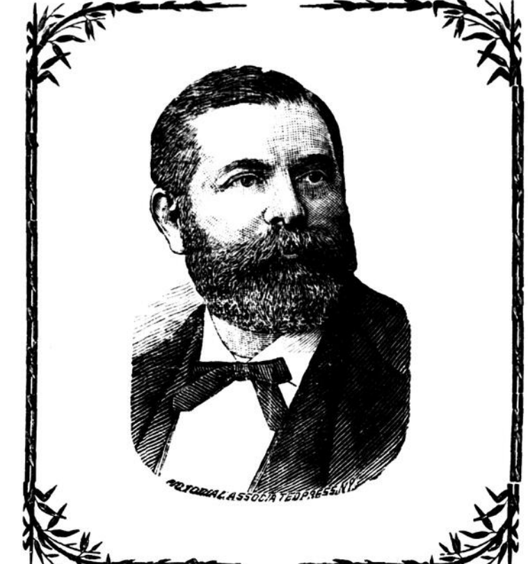
LEON ABBETT, Ex-Gouverneur de New-Jersey.