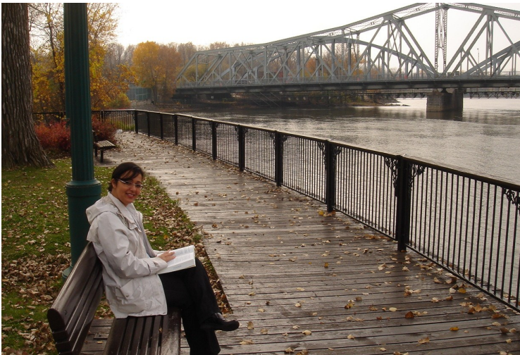
Ruba près de la rive au parc Belmont

Depuis mon arrivée sur l'île, je ne peux m'empêcher de rigoler en entendant mes collègues banlieusards se plaindre des ponts bouchés et des routes bloquées. Je redécouvre les joies du transport en commun, que je n'avais plus emprunté depuis la fin de mes études il y a une dizaine d'années.