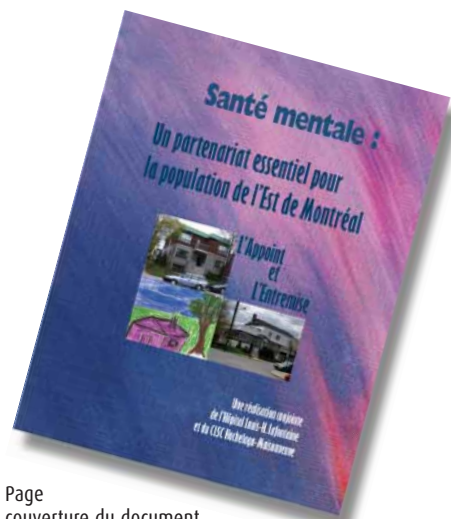
Page couverture du document de présentation de la candidature. Outre les photos de L'Appoint et de L'Entremise, un dessin réalisé par un usager est également reproduit.