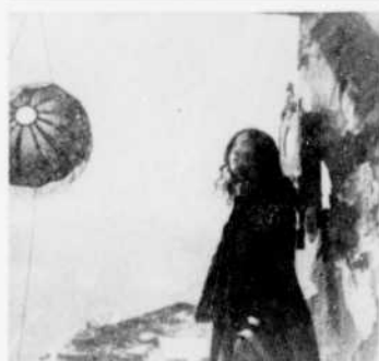
Le film "Quand passent les cigognes", de Kalatozov, est à l'affiche de l'émission "Images en tête", cette semaine.

11.00—Supplément régional 11.10—Nouvelles du sport 11.15—Cinéma "Un ange est passé sur Brooklyn", conte fantaisiste de Ladislav Vajda, avec Peter Ustinov et Pablito Calvo. Un propriétaire intraitable est changé en chien par une sorcière.