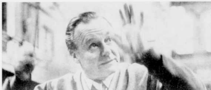
Le 26 décembre à 10 heures, à l'émission "Concert", diffusée chaque samedi soir, vous entendrez notamment la Symphonie no 3 de Saint-Saëns, sous la direction d'André Cluytens (notre photo).