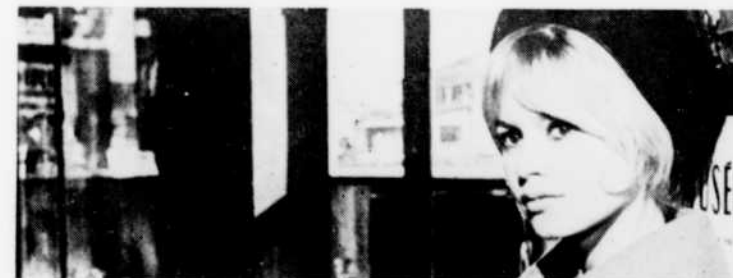
A la télévision, le soir du 1er de l'An, à 10 h. 15, "Bonne Année, Brigitte Bardot". A Winnipeg, cette émission sera télévisée à 10 h. 30 du soir, la veille du jour de l'An.