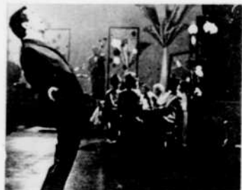
A 11 h. 05, le soir de la Saint-Sylvestre, la télévision vous présentera des extraits du "Parapluie magique", avec Gilbert Bécaud Dany Saval et Juliette Gréco.