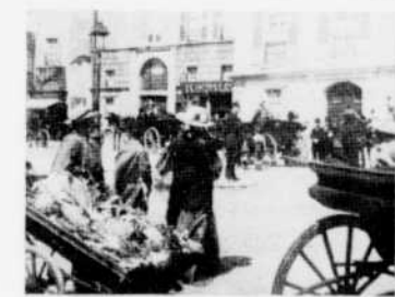
"Un chapeau de paille d'Italie", de René Clair, au "Ciné-club", le mardi soir 27 décembre à 11 heures.