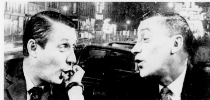
Cette semaine, "Les Couche-tard" sont parmi les invités de l'émission "Pleins feux".

"Le Soupirant", comédie de Pierre Etaix. Poussé par ses parents, un jeune Parisien renonce brusquement à la cosmographie pour partir à la recherche d'une épouse.