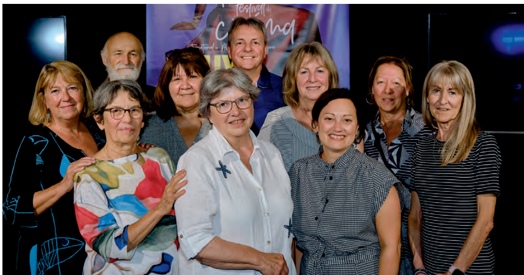
Les précieux bénévoles et collaborateurs lors de la conférence de presse du 23 août.

Enfin, impossible d'évoquer le festival sans parler de ses bénévoles, une trentaine en tout qui, pour plusieurs, s'investissent depuis des décennies. « Ce ne sont pas de simples bénévoles, c'est un véritable comité d'accueil », insiste la directrice, fière de pouvoir compter sur cette