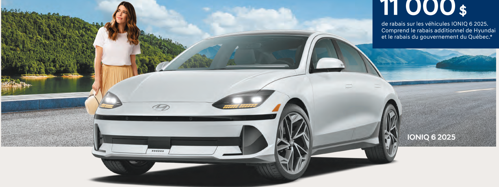
IONIQ 6 2025