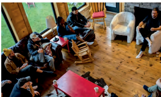
Souvenir de la Watch 2024, un événement qui permet la rencontre entre jeunes créateurs et professionnels du milieu.