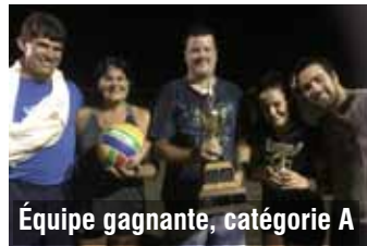
Équipe gagnante, catégorie A