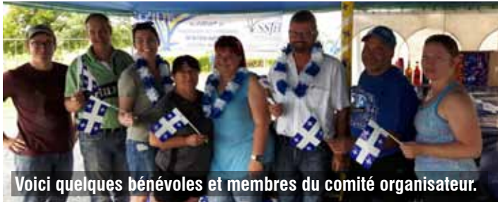
Voici quelques bénévoles et membres du comité organisateur.