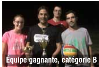
Équipe gagnante, catégorie B