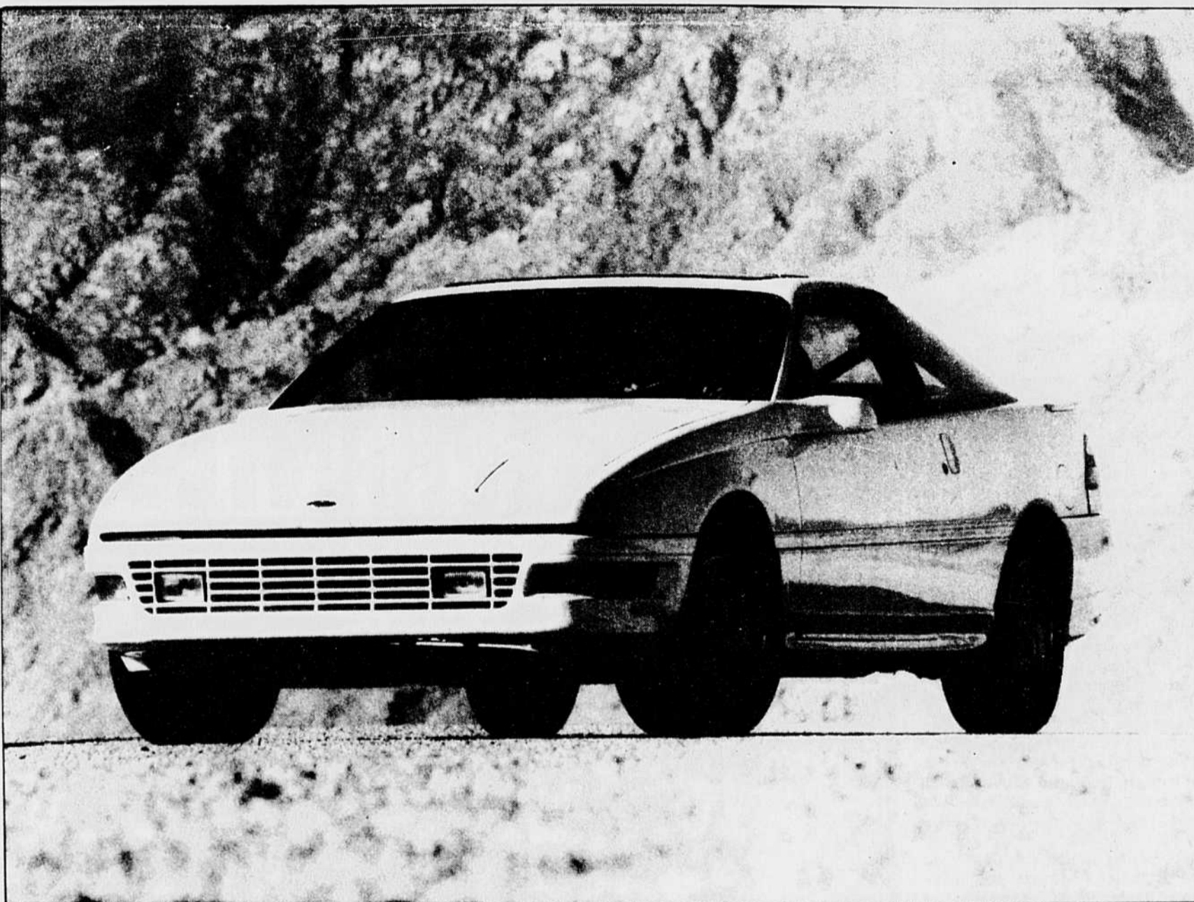
La Probe dispose d'une carrosserie légèrement redessinée chez toutes les versions. Pour sa part, la LX est désormais équipée d'un moteur V6 de 3 litres.

Si les nouveaux modèles ne font pas légion chez le deuxième cons-