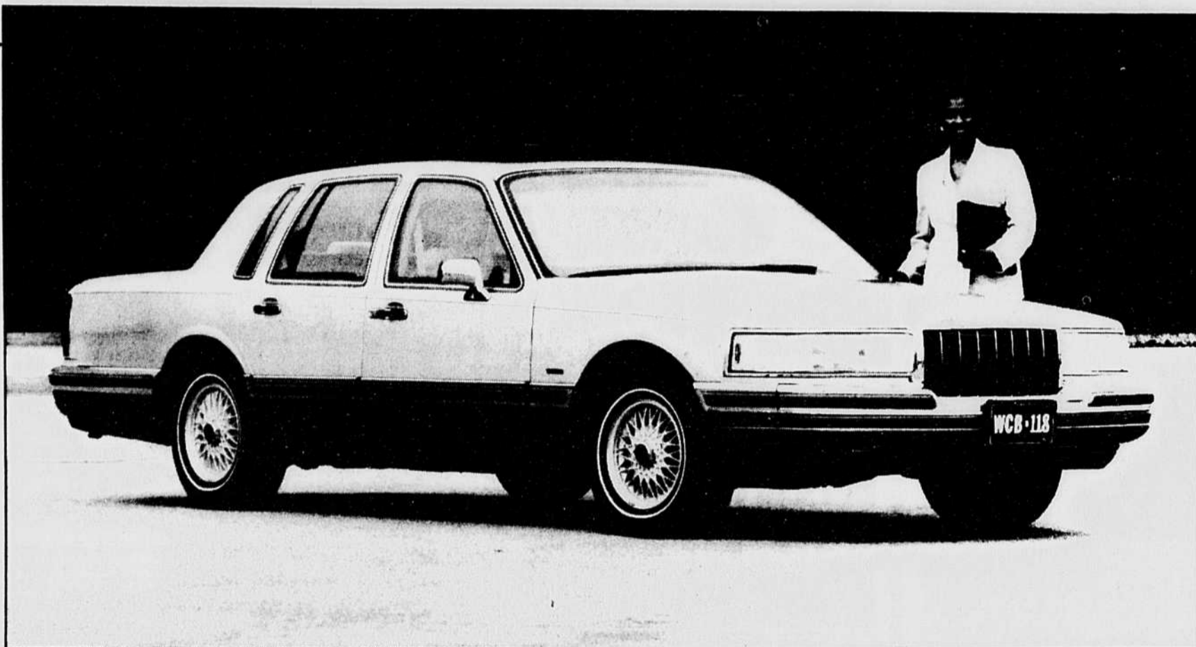
La berline de luxe plein format de Ford, la Town Car, adopte une toute nouvelle carrosserie en 1990. Une nouvelle direction ainsi qu'une suspension améliorée sont aussi au rendez-vous.

Quant à l'habitabilité, elle est toujours aussi impressionnante, au même titre que le coffre qui conserve ses dimensions gargantuesques. On peut donc dire qu'en conservant les vertus qui ont fait sa réputation, la Town Car gagne plusieurs raffinements qui font d'elle une voiture considérablement évolutive.