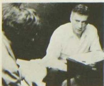
Etat de siège