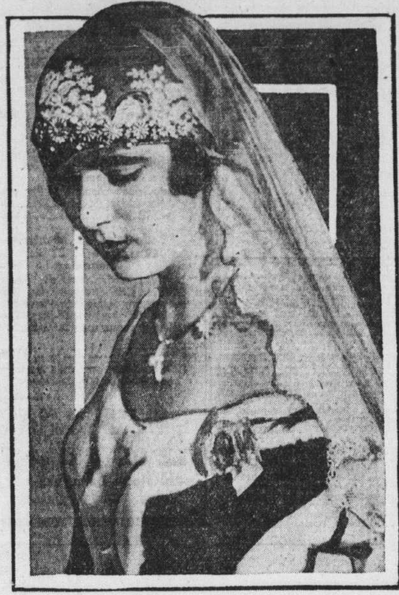
Voici un portrait de la Princesse Ingrid, petite-fille du Roi Gustav V de Suède, laquelle, dit-on, pourrait bien être demandée en mariage par le Prince de Galles. Celui-ci a près de quarante ans, alors que la jeune princesse en a vingt-deux. On la voit ici dans une magnifique toilette de cour.

comprends ben. Pour donner enne grosse exemple le bon Yieu l'a ben puni toute l'suite. Y a dit: l'as pas voulu écouter mes commandemens, pour te punir j'm'en vas l'monter dans 'lune. C'est depeu c'temps-là qu'y est là avec sa jarbe de blé sus l'ados."