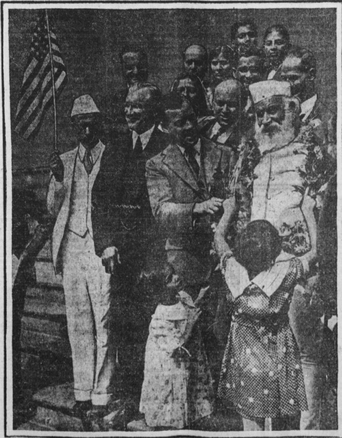
PATEL A NEW-YORK — Le maire McKee souhaite la bienvenue à l'homme d'Etat indien, en visite aux Etats-Unis.