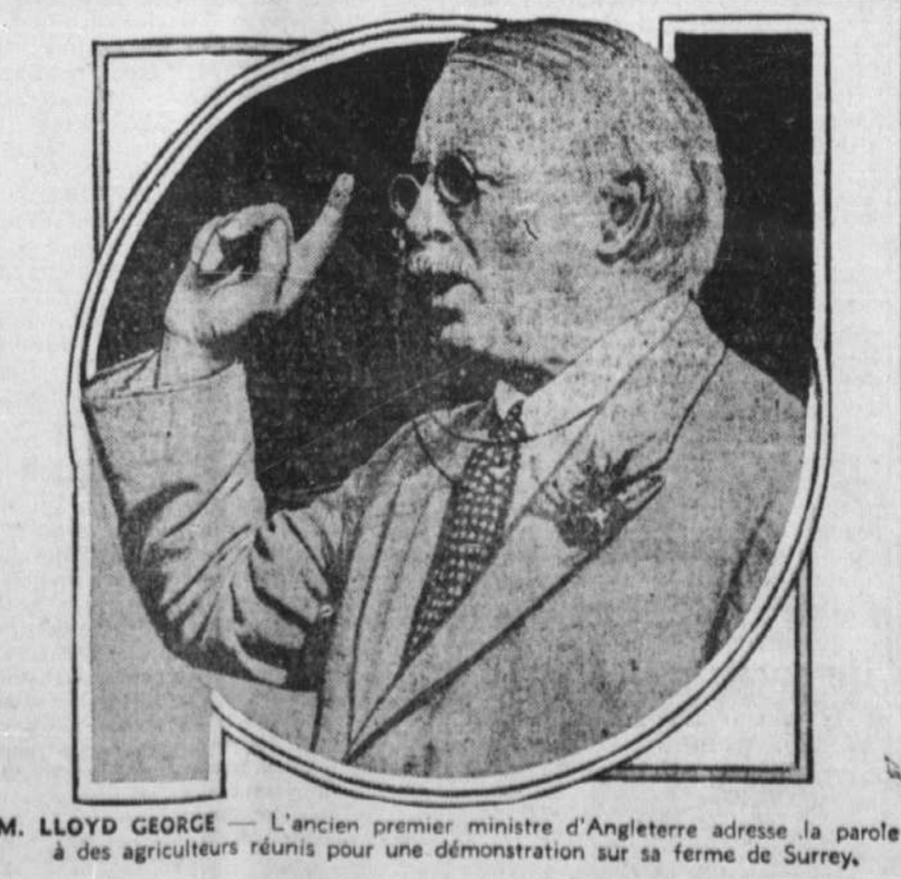
M. LLOYD GEORGE - L'ancien premier ministre d'Angleterre adresse la parole à des agriculteurs réunis pour une démonstration sur sa ferme de Surrey.

Bucarest, Roumanie, 28 (S.P.A.) - Une petite armée de sous-officiers à leur pension est arrivée dans la capitale aujourd'hui pour réclamer ce que le gouvernement leur doit.