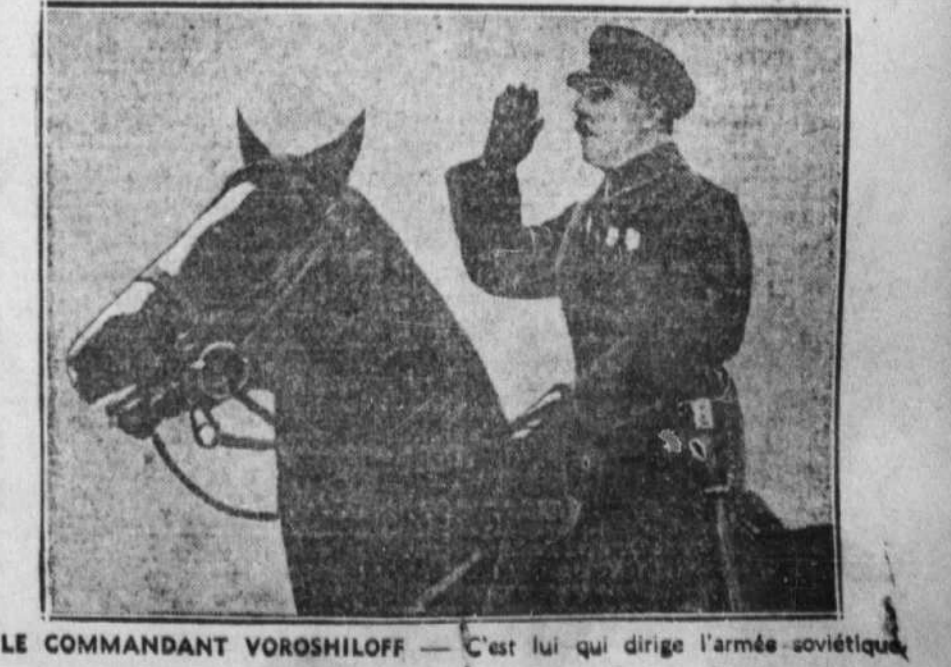
LE COMMANDANT VOROSHILOFF - C'est lui qui dirige l'armée soviétique.