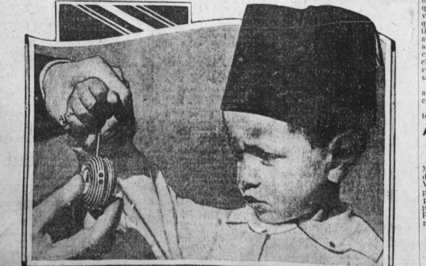
MOULAY EL HASSAN S'INTERESSE AU YO-YO — Le fils du sultan du Maroc, de passage à Paris avec son père, s'amuse avec ce nouveau jouet.

MM. Lucien Romier, économiste, et Raoul Blanchard, géographe, qui, tous deux nous accablent ces jours derniers d'importantes entrevues, prononceront des conférences sous les auspices de l'Alliance française, à Montréal, le 13 octobre et le 15 novembre respectivement.