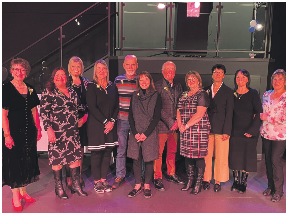
Le Centre de services scolaire de l'Estuaire a salué le départ à la retraite de 18 de ses employés.

finallement uni leur voix au sein d'une chorale pour l'interprétation d'une chanson rendant hommage aux personnes fêtées sur la musique de la pièce Et c'est pas fini de Stéphane Venne, reprise par Star Académie en 2003.