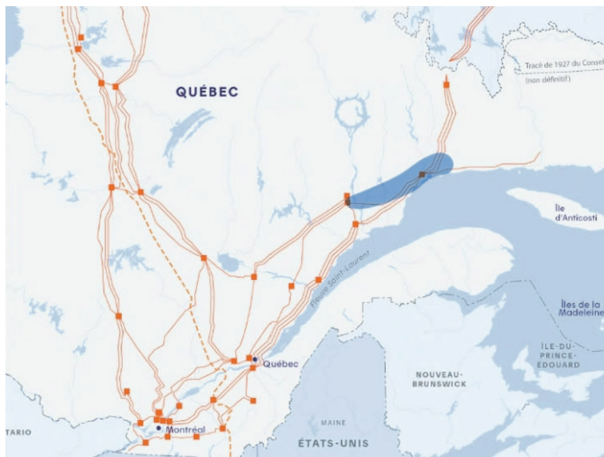
La zone en bleu est celle visée sur la Côte-Nord pour la construction d'une nouvelle ligne de transport et d'un poste électrique.

On ignore pour l'instant le tracé exact des nouvelles lignes. Hydro-Québec affirme avoir commencé les consultations, dans