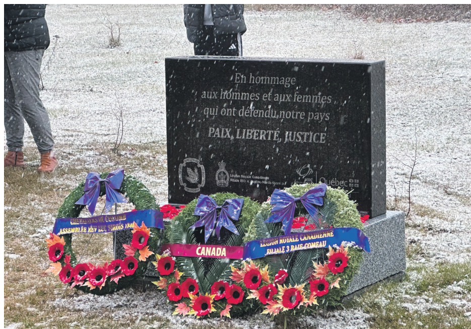
Trois couronnes ont été disposées devant le monument et les gens présents ont été invités à déposer leur coquelicot.

Après l'événement, tous les participants étaient invités au chaud à l'intérieur de l'hôtel de ville pour partager et boire un café. L'invitation est déjà lancée pour l'an prochain.