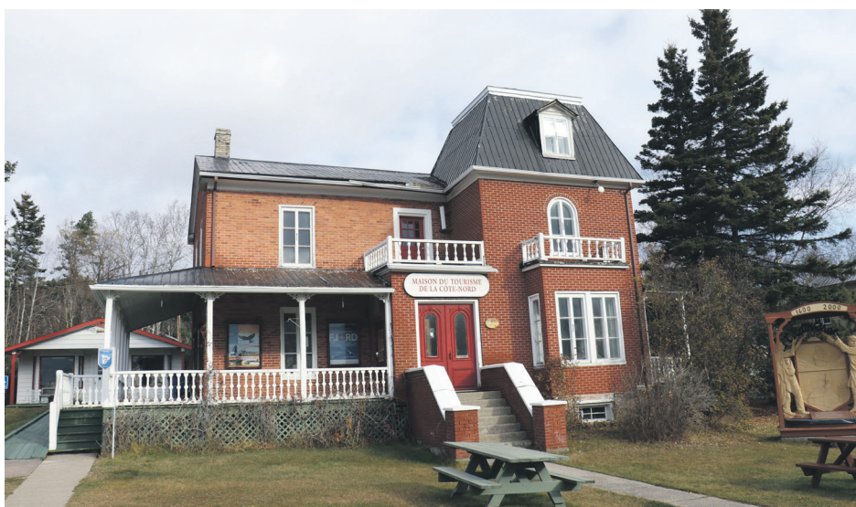
La Maison du tourisme de Tadoussac se transforme en Tiers Lieu entre les saisons touristiques.

Mme Nault invite donc la population à se tenir au courant des activités du Tiers lieu Tadoussac sur ses réseaux sociaux, et de participer à faire évoluer sa programmation en proposant des activités.