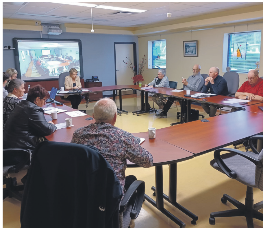
Les municipalités de la Haute-Côte-Nord, qui possèdent moins de 2 000 habitants, resteront à six conseillers.

Les municipalités qui répondent à ces critères et qui souhaitent réduire leur nombre de conseillers en vue de l'élection générale de 2025 doivent adopter leur règlement au plus tard le 31 décembre 2024.