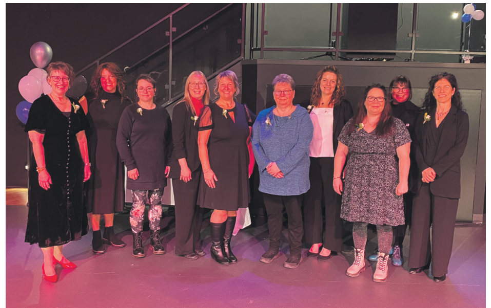
Voici une partie des 12 membres du personnel du Centre de services scolaire de l'Estuaire qui ont célébré 25 ans de service.

Afin de clore la partie protocolaire en beauté, les cadres de service et de direction du CSS de l'Estuaire ont