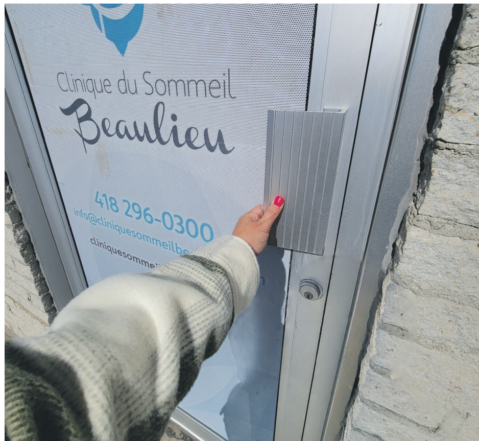
À plus d'une reprise, Le Manic s'est rivé le nez sur une porte barrée lors des heures d'ouverture annoncées par la Clinique du sommeil Beaulieu.