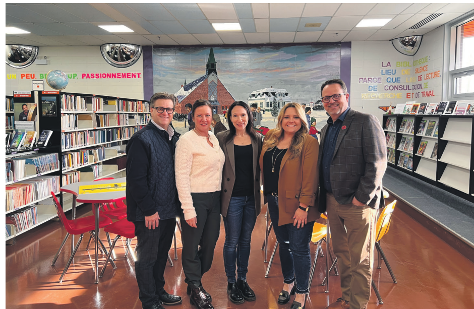
Les membres de la Commission parlementaire spéciale vont à la rencontre des jeunes du primaire et du secondaire. Ils visiteront une vingtaine d'écoles dans six régions. Les voici à Pessamit.

«On va ensuite analyser quelles recommandations on peut faire, mais comment on peut aussi continuer à gérer notre rapport avec nos écrans, nos cellulaires, nos ordinateurs, etc.