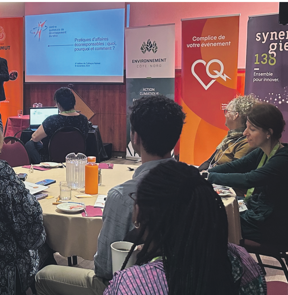
Le Colloque Azimut a réuni plus de 70 personnes à Forestville le 6 novembre.