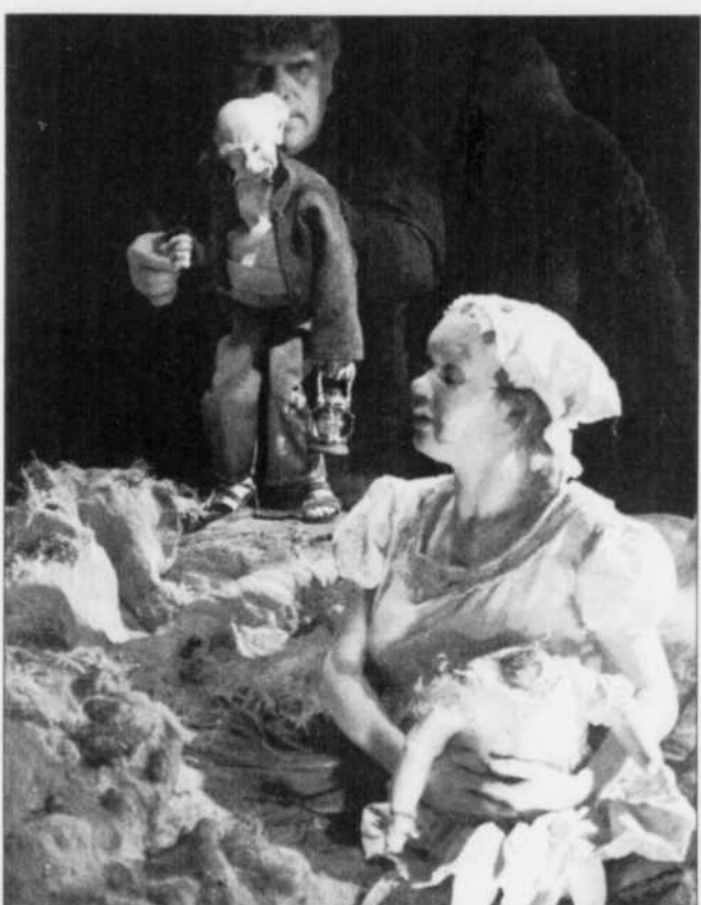
Les acteurs-manipulateurs sèment les digressions et éperonnent le théâtre.

Saucier fait une illustration baroque et délirante de cette fable qui a l'actualité mondiale dans sa mire. Le guerrier Cesar Guzman tient d'un certain président américain monté sur châssis Schwarzenegger! S'est-il en tout collé au texte? En tout cas, il s'en donne à cœur joie. Et ses acteurs-manipulateurs donc, qui sèment les digressions, éperonnent le théâtre, traversent le quatrième mur comme la guérilla les frontières pour provoquer musiciens et public, pastichent le cinéma manichéen de l'après-guerre, s'adonnent