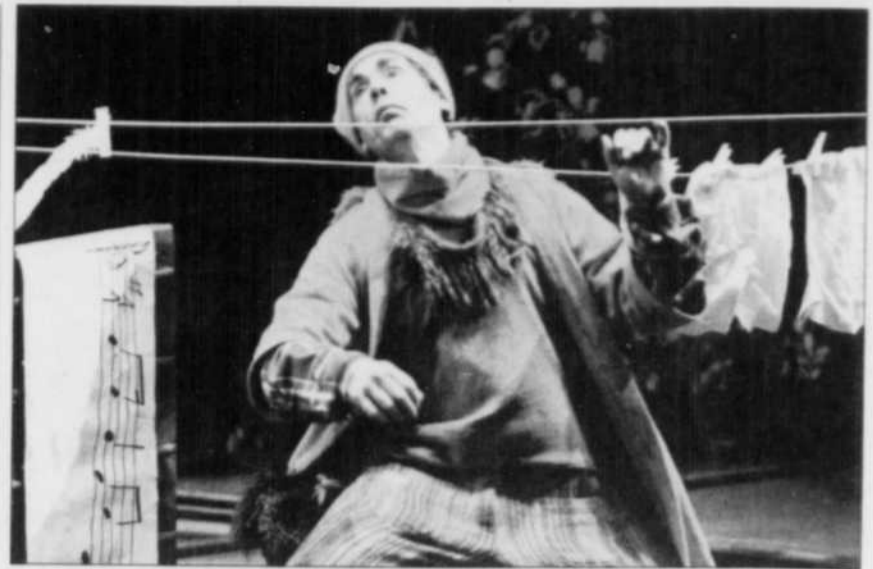
Taciturne

Plus tôt cette année, l'organisation annonçait, outre ce dernier concert, la présence des trios d'Oliver Jones et d'Oscar Peterson pour la soirée de clôture, ainsi que des concerts de k.d. lang avec l'Orchestre symphonique de Montréal, de Diana Krall, de Diane Reeves et d'Ibrahim Ferrer.