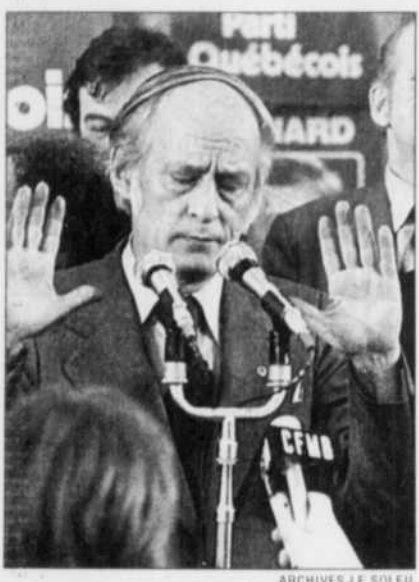
René Lévesque le 15 novembre 1976

■ Révélé au grand écran dans Maëlstrom et populaire pour son rôle de Jack Carter à Radio-Canada , Jean-Nicolas Verreault tourne en ce moment dans la version cinématographique de Survenant , de Germaine Guèvremont, où il incarne le rôle-titre. Jean-Luc Mongrain s'entretient avec l'acteur originaire de Québec. Le Grand Journal , TQS à 16h30.