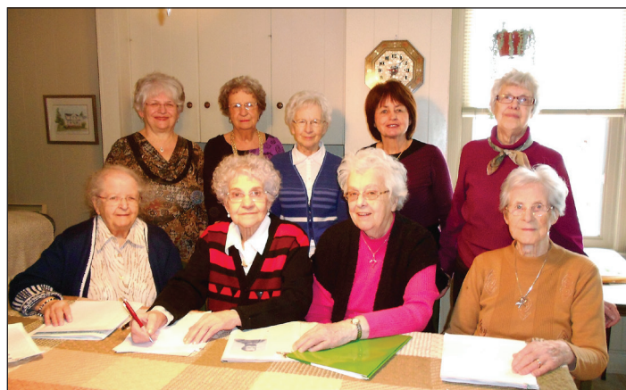
Collectif de femmes engagées d'Alma

Beaucoup d'ignorance ou d'indifférence relative à ce projet a été constatée suite à la consultation faite par le CFEA dans les six CSSS au Saguenay-Lac-St-Jean, de même qu'à l'Agence de santé et des services sociaux de la région. Ce qui suit le confirme. Aucun des Conseils d'administration des établissements n'a fait l'étude du projet, n'a pris position sur le sujet, n'a voté une résolution en bonne et due forme, n'a fait un sondage auprès des médecins, des membres du personnel professionnel et des autres intervenants du milieu; aucun d'eux n'est intervenu auprès de l'AQESSS. À l'un des CSSS, il a été répondu verbalement: « Le gouvernement est notre patron, on n'a rien à dire; le gouvernement fait les lois qu'il veut. » Quant