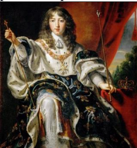
Louis XIV, 16 ans (Juste d'Egmont)