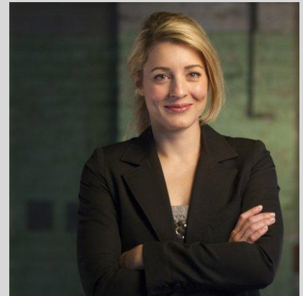
La candidate à la mairie de Montréal Mélanie Joly