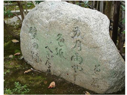
Pierre gravée d'un haïku

Alone, in old clothes, sipping wine Beneath the moon