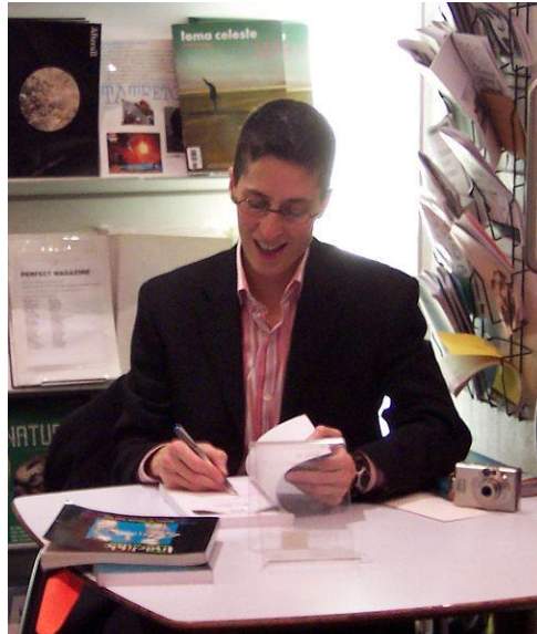
Alison Bechdel a conçu le test de Bechdel qui évalue la place accordée aux femmes à l'écran.

Il est à noter que ce test ne révèle aucunement si un film est sexiste ou non : il indique simplement si des femmes y sont minimalement présentes. Malgré cela, parmi les