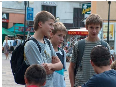
Un étudiant X