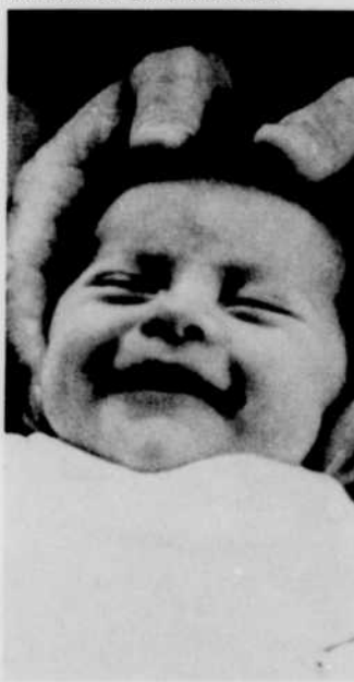
Naissance sans violence