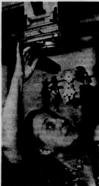
La réalisatrice Lotte Reiniger

Les téléspectateurs voudront bien noter que Ciné-club passe désormais à 23 heures.