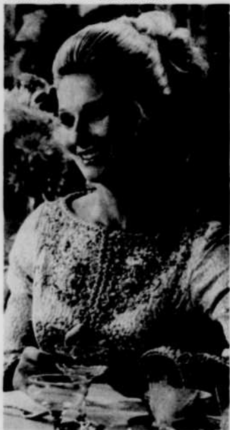
Lune de miel aux orties

Cette étude de moeurs amusante et pessimiste à la fois nous présente divers sujets de réflexion sur l'amour conjugal et les relations extra-maritales.