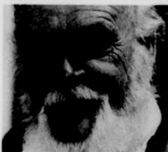
Lanza del Vasto