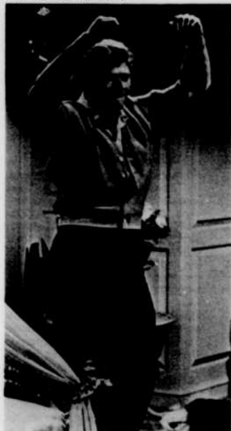
Fièvre sur la ville